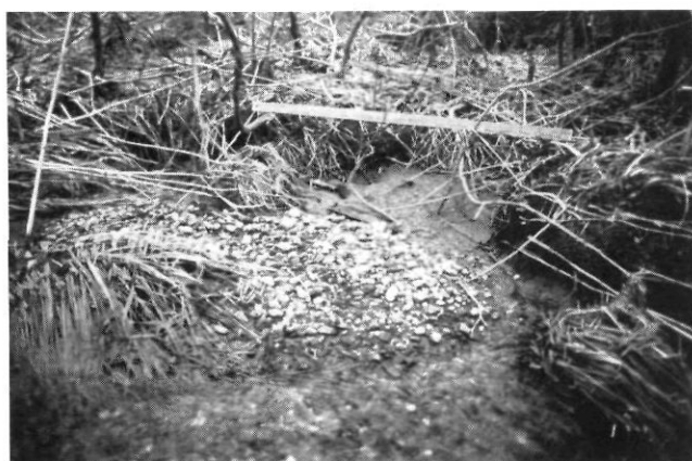
FIGURE 4. Entailles de la berge par des rigoles à proximité du cours d'eau au pied du versant déboisé.

Rill development near the stream channel (behind the bushes).