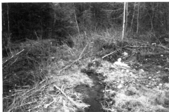
FIGURE 3. Développement de rigoles à proximité du cours d'eau (derrière les broussailles), au pied du versant déboisé.

Rill development near the stream channel (behind the bushes).