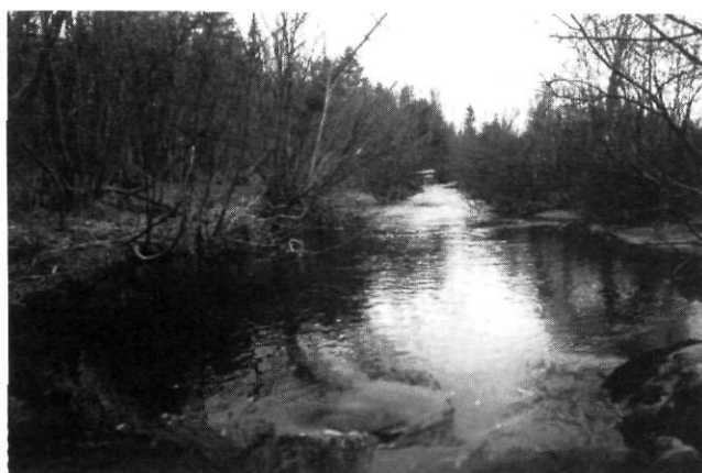
FIGURE 5. L'asymétrie de la coupe transversale sur le côté déboisé (à droite).

Erosion of the stream bank by rills developed on the logged slope.