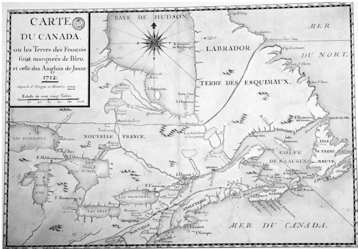
La perte de Terre-Neuve, de la baie d'Hudson et de la péninsule acadienne paraît ici contournée en jaune, même avant le Traité d'Utrecht, mais l'auteur de cette carte situe les Iroquois en Nouvelle-France. «Carte du Canada ou les terres des Francois sont marquées de bleu et celle des Anglois de Jaune, 1712, d'après le Sieur Couagne en decembre 1712.»