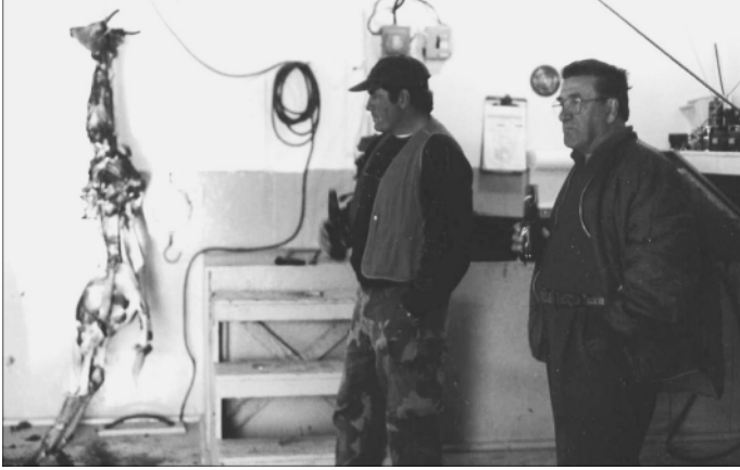
Clients observant le guide débiter un chevreuil, Geneviève Brisson, 2001.