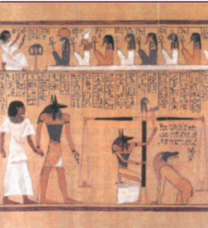
Figure 3. La «pesée du cœur» (papyrus Hounefer, 19 e dynastie). Cette pesée se déroulait devant un tribunal divin présidé par Osiris, Isis et Nèphthys. Au milieu de la salle se trouvait une balance. Sur l'un des plateaux était déposé le cœur du défunt, siège de la mémoire de toutes ses actions pendant sa vie. Sur l'autre, Anubis déposait une plume, symbole de Maât, déesse de la vérité et de la justice. Si le cœur et la plume s'équilibraient, le défunt était appelé «juste de voix», et son akh accédait à la vie éternelle où l'accueillaient tous les vivants «justifiés» qui l'avaient précédé sur terre. Si le cœur était trop lourd, « Ammit la mangeuse » le dévorait, et le défunt était voué à l'errance éternelle (British Museum, Londres).

De la même façon que les Égyptiens ont évoqué une relation entre le cœur- haty et les metou , ils ont établi une relation entre le cœur- haty et le cœur- ib . La dénomination de cœur- ib a prêté à confusion dans l'interprétation des papyrus médicaux; selon Thierry Bardinet, on devrait lui préférer la traduction mieux adaptée d'«intérieur- ib », qui comprend l'organisme dans sa globalité excepté le cœur- haty et qui a l'avantage de souligner l'ambivalence anatomique et mystique du ib : « Toute cette partie de l'intérieur du corps de l'homme qui semble douée d'une vie propre autonome et divine, faisant que pour l'essentiel, le corps donne l'impression de fonctionner tout seul, ou du moins d'être animé par un souffle d'origine externe » [21]. Finalement, l'intérieur- ib correspondrait à un ensemble anatomique comprenant tout ce qui se trouve dans l'enveloppe corporelle ( shet ), c'est-à-dire les metou et leur contenu, fluides et souffles vitaux, mais aussi tous les organes thoraciques et abdominaux,