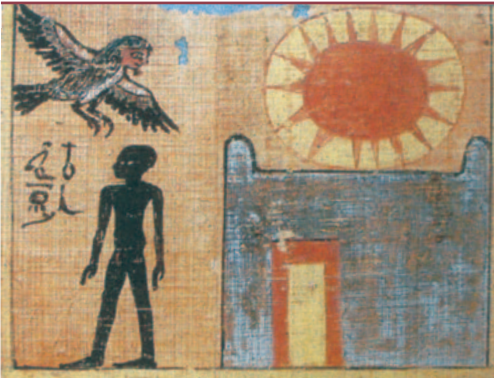
Figure 1. Le Ba, le nom et l'ombre (Livre des Morts de Néfroubenef, 18 e dynastie (musée du Louvre).

Les Égyptiens se sont livrés à une réflexion tout à fait originale, témoignant d'une volonté de comprendre et d'expliquer le fonctionnement de l'organisme afin d'adopter une pratique médicale rationnelle. Dans la pensée médicale égyptienne, les organes étaient considérés non pas comme des entités individualisées,