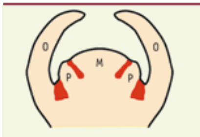
Figure 1. Méristème et domaines frontières. Le méristème (M) produit des primordia (P) sur ses flancs qui se développeront en organes (O), telles les feuilles. Un domaine frontière ici en rouge sépare les primordia entre eux et du méristème.

> Chez les plantes, tous les organes latéraux de la partie aérienne, qu'il s'agisse de feuilles ou de pièces florales comme les pétales ou les étamines, sont issus des méristèmes. Ces structures en prolifération contiennent les cellules souches de la plante et sont le siège d'une organogénèse continue. Au sein des méristèmes, suivant un minutage et à une position finement contrôlés, un groupe de cellules va s'individualiser, bourgeonner en un primordium et donner naissance à un organe (Figure 1). Les primordia d'organes sont séparés entre eux et du méristème par un domaine frontière formé par un ruban de cellules. Les cellules appartenant à ces domaines sont reconnaissables par les gènes qu'elles expriment. Ainsi, chez la plante modèle Arabidopsis thaliana , les cellules des domaines frontières expriment les gènes CUC1 , 2 et 3 [1-3]. Ces marqueurs moléculaires des domaines frontières en sont