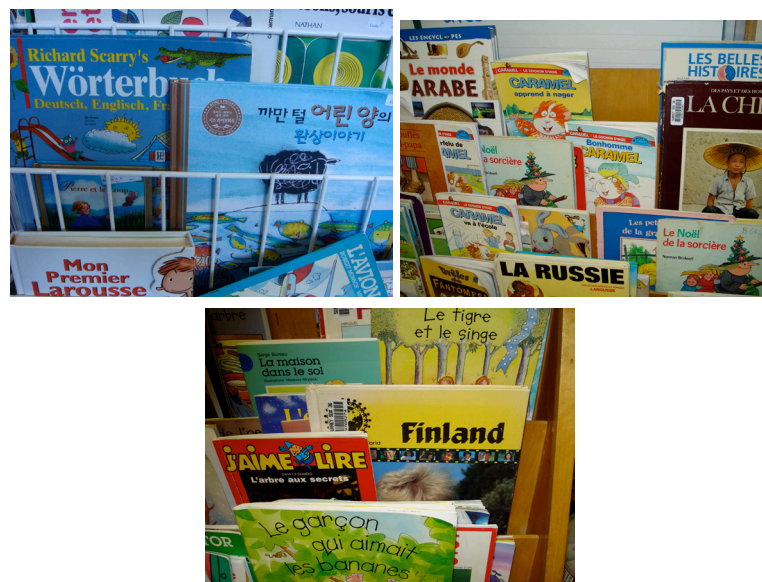
Exemple 2. La variété des livres disponibles dans les coins lecture dans les classes

Ces coins lecture se caractérisent tous par la pluralité des ouvrages qui s’y côtoient et se définissent d’emblée comme des lieux où plusieurs langues et cultures sont en contact et sont mis au service de l’entrée dans la littérature du et en français (exemple 2). Ainsi, à côté d’ouvrages techniques propices au développement d’une langue normée et scolaire – Mon premier Larousse et le Dictionnaire actif Nathan , cohabitent d’autres livres qui racontent Les Belles Histoires , soulignent le plaisir de l’acte de lire avec la collection J’aime lire , ou font sur le mode informatif découvrir le monde animal comme Les araignées et leurs toiles . Certains sous forme d’atlas invitent à la découverte d’environnements lointains, tels La Russie , La Chine ou Le monde arabe , en français ou en anglais ( Finland ), soulignant par là même la cohabitation des deux langues du Canada dans la classe. D’autres mettent en scène différents personnages dans diverses situations, Caramel apprend à nager , L’espion sous l’eau , La visite de grand-maman , pour ne citer que quelques exemples. Les thématiques sont en lien avec le monde de l’enfance et de l’imaginaire, mais également avec les sujets abordés par le curriculum; elles soulignent plus ou moins explicitement certains traits culturels, notamment locaux et spécifiques à la Colombie-Britannique.