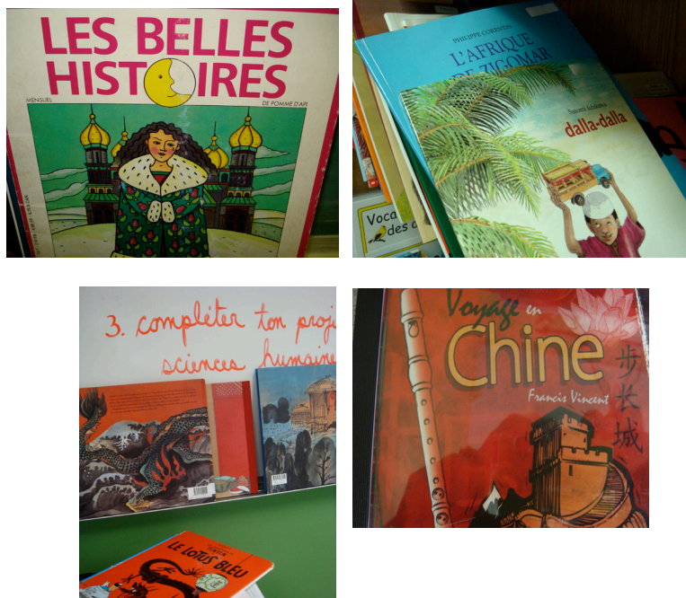
Exemple 6. Les Belles Histoires , L'Afrique de Zigomar , dalla-dalla , Tintin et le lotus bleu et Voyage en Chine

Dans toutes les classes observées, illustrant le type d) des livres plurilingues, on note la présence de nombreux contes autochtones canadiens, en français, en anglais, bilingues ou trilingues, parfois dans plusieurs systèmes d'écriture. Outre la présence dans le texte en français de noms de personnages clairement autochtones (Anaanatsiaq, Eskéo dans Les Papinachois et le panier d'écorce ) ou l'utilisation d'un lexique emprunté (les lemmings) ou le style des illustrations ( L'équipée fantastique ), la présence de l'autre ainsi que sa valorisation peuvent également se traduire par la graphie qui est utilisée pour raconter l'histoire. Ainsi dans l'ouvrage Un Inukshuk solitaire ou encore La grand-mère d'Aputik (exemple 7), rencontrés dans les coins bibliothèque de plusieurs classes d'immersion et du programme francophone, la dimension bilingue et pluriculturelle apparaît à la fois dans l'utilisation de la version syllabaire de l'inuktitut et sa présence aux côtés de la langue française, bien que située en dessous, et dans la mise en exergue des liens intergénérationnels et de la place sociale majeure des aînés dans les communautés autochtones. La disposition des langues et leur partage de et sur la page révèlent la manière dont chaque langue possède et occupe son espace. Ils illustrent aussi, symboliquement, la cohabitation des langues et des cultures, à l'image d'un Canada officiellement bilingue et multiculturel.