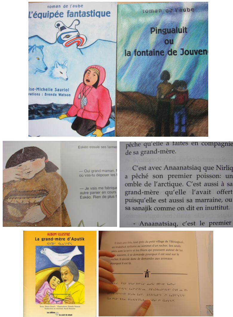
Exemple 7. L'équipée fantastique , Les Papinachois et le panier d'écorce , La grand-mère d'Aputik et Un Inukshuk solitaire (Classes de R. et de C., Programme francophone)

L'entrée dans l'écrit s'effectue ici par l'utilisation concomitante de deux systèmes d'écriture et s'inscrit donc au niveau des alphabets, qui dès lors deviennent des objets culturels par essence, alors que les dimensions d'oralité des langues qui interagissent avec leurs variétés scripturales, l'inscrivent dans des référents sémiographiques (illustrations, symboles, couleurs, lettrages) (Moore, 2012) conditionnés par l'univers de référence culturelle auquel le récit veut se rattacher. Si l'histoire peut se raconter et se lire en français, elle réfère de par sa scénographie et son visuel à un univers autochtone régi par des codes culturels précis. Dans un environnement sociolinguistique et culturel comme la Colombie-Britannique où de nombreuses langues autochtones sont encore présentes, ces livres dans les salles de