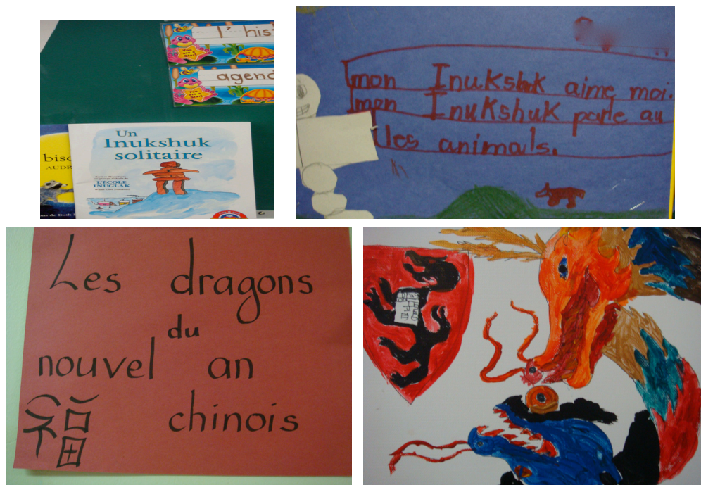
Exemple 8. L'Inukshuk solitaire (Classe de J. – Immersion) et Les dragons du nouvel an chinois (Classe de B. – Programme francophone)

Les séquences d'exploitation didactique des livres bi-/plurilingues menées par les enseignants révèlent toutes l'instauration d'un espace collaboratif pour partager des savoirs et des pratiques autour des littératies scolaire, familiale et communautaire et construire ensemble des compétences plurilittératiées. Dans les classes où les études de cas ont été menées, les livres bi-/plurilingues en circulation participent à établir, par delà les coins bibliothèque, l'espace de la classe comme un espace bi-/plurilingue et pluriculturel et d'ouverture à l'altérité, où circulent et se négocient des formes diverses de savoirs qui se construisent et s'appuient sur les expériences et les capitaux culturels et symboliques des élèves (Perregaux, 2009).