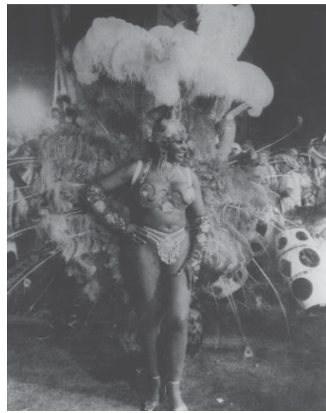
ill. 4: photographie tirée de l'ouvrage Historia estampada , 1997.

Cette inoubliable noire [morena] promenait sa silhouette, le feu de son candombe et sa tendresse sans limites dans toutes les « comparsas » [groupes musicaux de carnaval] de Montevideo [...], le quartier sud et Palermo, la rue Anzina, qui n'existe plus, sous la houlette et la direction de Pedrito Ferreira et son groupe Black Fantasy, des nuits entières, où régnaient tambours, vins et roses [...]; cela eut pour résultat de tremper encore plus le caractère de cette impressionnante femme noire qui, selon [un célèbre chanteur populaire], « abritait mille tendresses dans ses hanches parcheminées comme une peau de tambour ». 13