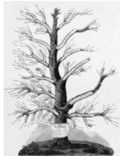
«Arbre des dermatoses» de J.-L. Alibert (1833)

Dans cette classification, Alibert tient compte des altérations morphologiques, mais en même temps il prend en considération l'âge, le sexe, le tempérament, les saisons et le climat, et les met