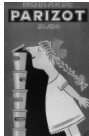
Illustration 6 Raymond Savignac, Moutarde Parizot , 1952. © Succession Raymond Savignac / SODRAC 2007

tre, évidé, est occupé par un garçon de café sur le plateau duquel se trouve une bouteille de la marque de référence. Or, parce qu'il est un rien suffisant, parce qu'il ne « manque pas d'air » (comprenez aussi « d'R »), le garçon, qui répond à la commande (Garçon ! un R), est-il à même d'affecter l'arrogance (l'air supérieur) de qui se sent dépositaire d'un objet convoité (l'apéritif « R »).