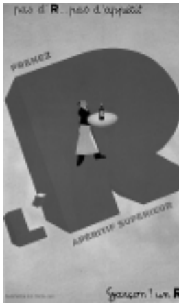
Illustration 5 Paul Colin, Prenez L'R , 1933, 150 x 99 cm. © Succession Paul Colin / SODRAC 2007