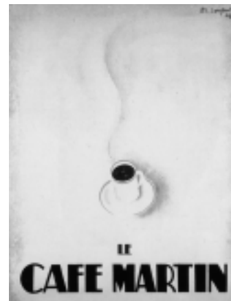
Illustration 2 Charles Loupot, Le Café Martin , 1929. © Succession Charles Loupot / SODRAC 2007

Au pied de la lettre géante (rouge et brune), une tasse de thé, vue en plongée, se donne à la fois comme objet disposé et comme offrande déposée. L'ordinaire profane se mâtime de « ritualité ». Se voit donc ici associée au signe du réconfort la marque d'un cérémonial. Cela a pour effet d'inviter le lecteur/spectateur à se compter au rang des sectateurs de la high life qui voulait, en 1930, qu'on fût anglophile, partant, qu'on considérât le café comme une boisson trop ordinaire. En ce temps-là, Twining , c'était un