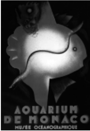
Illustration 3 Jean Carlu, Aquarium de Monaco , 1926, 99 x 70 cm. © Succession Jean Carlu / SODRAC 2007