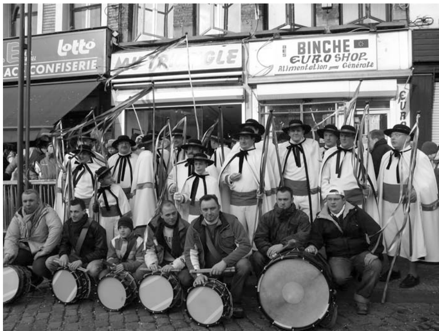
Une société et sa batterie. Photo Claire Desmeules, février 2006.

C'est la journée la plus haute en couleurs. Les futurs Gilles, Paysans, Arlequins et Pierrots portent un costume de fantaisie. Ces déguisements sont créés des mois à l'avance dans le plus grand secret. Ils sont individuels ou de groupes (lorsque les membres d'une même société ou « cagnotte » décident d'un déguisement commun). Toutes les fantaisies sont permises, les thèmes traités étant innombrables. C'est le Dimanche gras que sortent les Mam'zelles , alors que les participants se déguisent en femmes. L'idée est, selon l'esprit même du carnaval, de renverser l'ordre des choses, de créer un monde à l'envers où