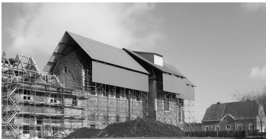
La Paix-Dieu. Une aile de l'ancienne abbaye en cours de restauration. Le Centre de perfectionnement en métiers du patrimoine sert aussi de chantier-école.

étudiés sont diversifiés : architecture traditionnelle, charpenterie, taille de la pierre, colombage et torchis, peinture en décor, dorure, ferronnerie, archéologie du bâtiment, conservation des jardins historiques, toiture, etc.