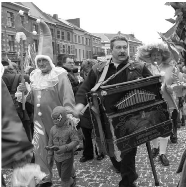
Un joueur de viole. Photo Claire Desmeules, février 2006.