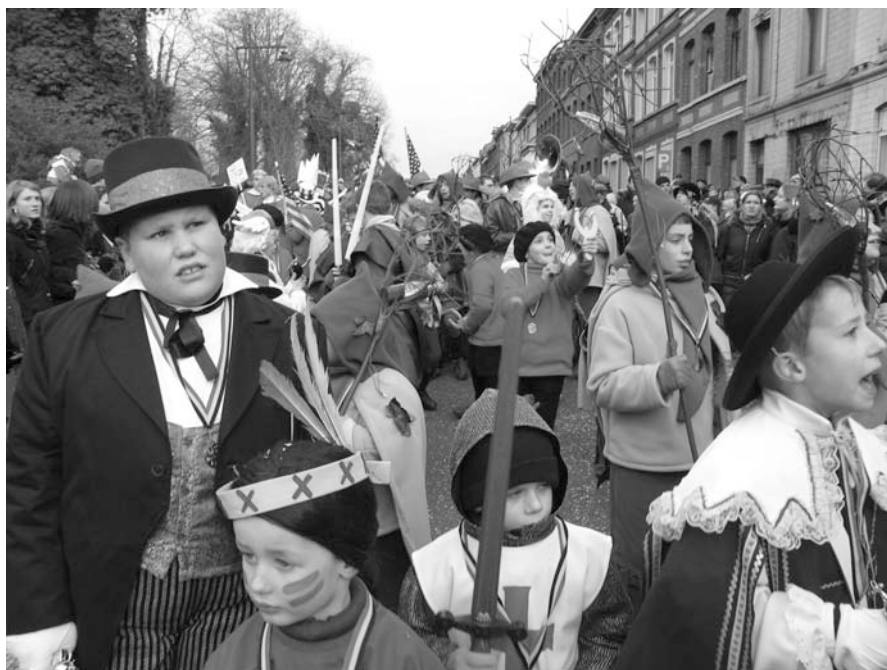
Le cortège de l'après-midi du Dimanche gras. Petits Gilles portant des déguisements colorés. Photo Claire Desmeules, février 2006.