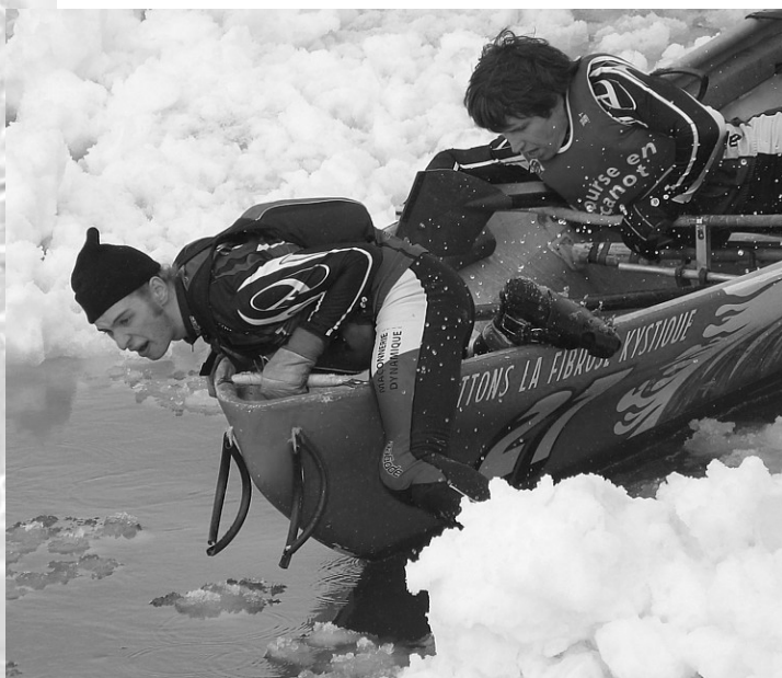
Canotiers sportifs en action. Photo Michel Corboz, 2007.

Louis Fréchette, La Noël au Canada , 1900