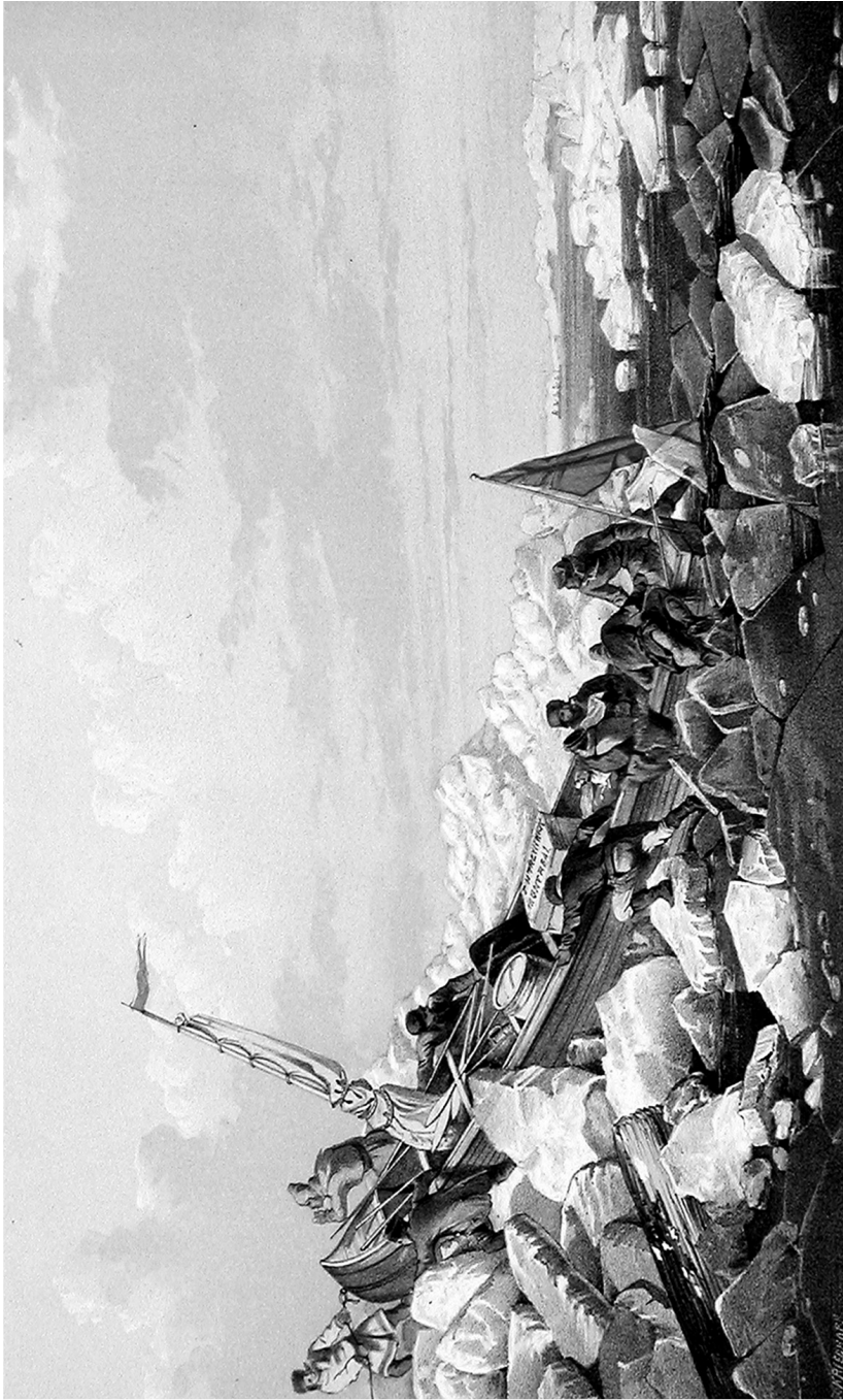
Passengers and Mail Crossing the River. Cornelius Krieghoff, encre et aquarelle sur papier, 1860. Musée McCord d'histoire canadienne, Montréal, n° M15934.47.