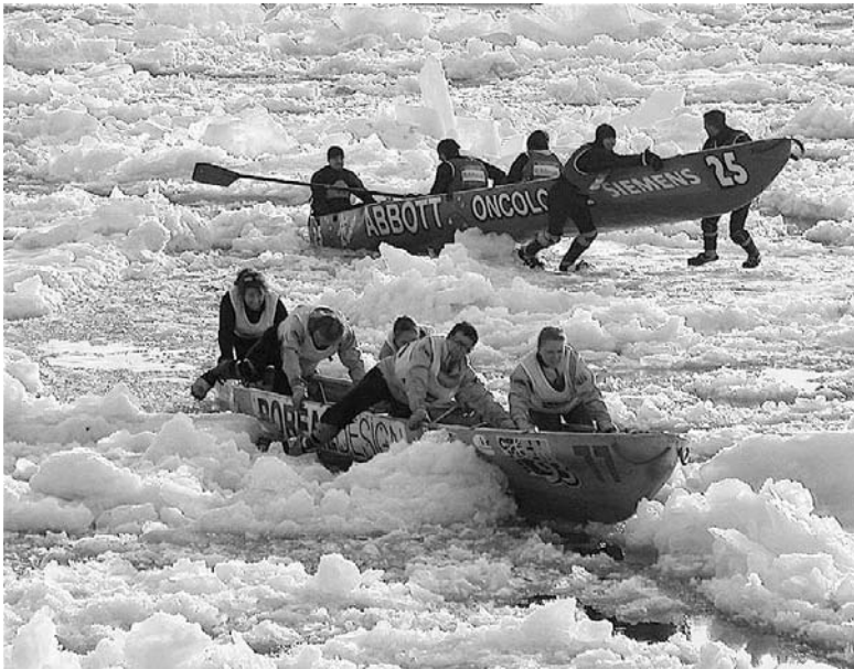
Course du Carnaval de Québec.

On entend par « patrimoine culturel immatériel » les pratiques, représentations, expressions, connaissances et savoir-faire – ainsi que les instruments, objets, artefacts et espaces culturels qui leur sont associés – que les communautés, les groupes et, le cas échéant, les individus reconnaissent comme faisant partie de leur patrimoine culturel. Ce patrimoine culturel immatériel, transmis de génération en génération, est recréé en permanence par les communautés et groupes en fonction de leur milieu, de leur interaction avec la nature et de leur histoire, et leur procure un sentiment d'identité et de continuité, contribuant ainsi à promouvoir le respect de la diversité culturelle et la créativité humaine [...] 10 .