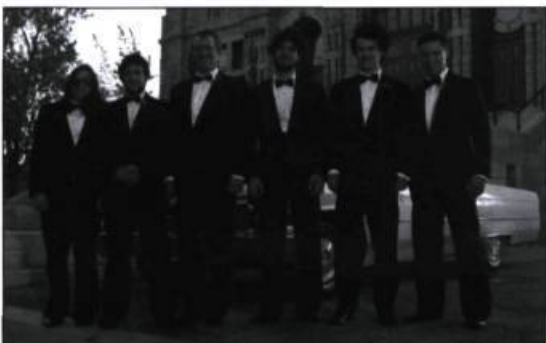
... à deux époques différentes

Oui. Pendant les 10 mois où j'ai travaillé d'arrache-pied sur le scénario, j'avais déjà ces musiques en tête. Je suis allé jusqu'à faire lire le scénario accompagné d'un CD des différentes chansons qu'on retrouve dans le film. À chaque fois que j'ai déposé le scénario, celui-ci était accompagné du CD. L'écriture s'est faite en lien très étroit avec la musique. Je savais, par exemple, que Gervais — le père — faisait précisément tel geste sur telle note de musique.