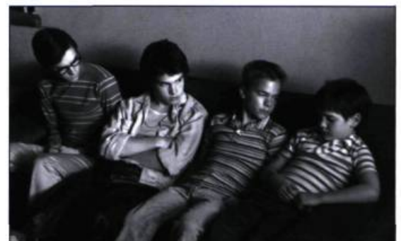
Les frères de C.R.A.Z.Y...

Le look de Zac a été très étudié et minutieusement travaillé. En réalité, je me suis inspiré de Bruce Lee. Pour le Zac, âgé de 15 ans, j'ai fourni au département CCM (coiffure, costume, maquillage) une vingtaine de photos de Bruce Lee. J'ai envoyé Marc-André Grondin, le comédien qui joue Zac,