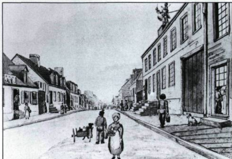
Cette aquarelle de James Pattison Cockburn montre, du côté gauche, la boutique du marchand d'eau minérale du faubourg Saint-Jean, Québec. (Royal Ontario Museum).

se distingue des quatre autres cours d'eau connus, comme le ruisseau Saint-François ou Prévost, les fontaines du Sault-au-Matelot, de Champlain, et particulièrement celle dite d'Abraham Martin ou Claire-Fontaine. Cette dernière, enfouie sous une maison construite peu après la Conquête, fait depuis l'objet de recherches.