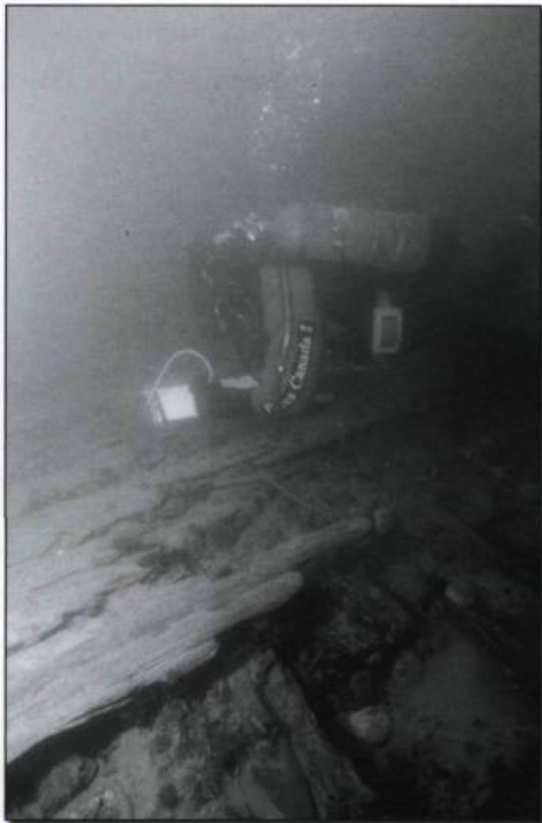
Un plongeur inspecte la coque d'un navire non identifié du XIX e siècle qui s'est heurté à un des nombreux récifs dans l'estuaire du Saint-Laurent.

Hormis les embûches naturelles imposées par le Saint-Laurent lui-même, les navigateurs ont parfois eu à faire face, au fil des ans, à d'autres périls qu'ils se sont infligés entre eux. Les conflits qui sévirent à différentes époques ont souvent engendré des dangers supplémentaires pour les navires qui voyagent sur le fleuve. La plupart des engagements eurent généralement lieu, ou bien, pour la période de la Nouvelle-France, à l'entrée du golfe du Saint-Laurent où pullulaient les corsaires de nationalités diverses, ou bien, pour le Régime britannique, sur les Grands Lacs et le lac Champlain où les flottes britanniques et américaines s'affrontèrent directement. Toutefois, certains affrontements se produisirent à l'intérieur du golfe Saint-Laurent. L'exemple le plus connu est certainement celui de trois navires français qui, en route vers Québec, se réfugièrent dans la baie des Chaleurs où ils furent coincés par