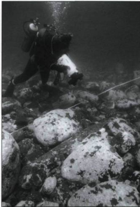
Un plongeur filme un des canons du vaisseau du Roi, le Corosso , coulé lors d'une tempête de l'automne 1693, alors qu'il tentait de regagner la baie de Sept-Îles. (Photo : Marc-André Bernier, Parcs Canada).

trois mois, mis à part un court débarquement à Beauport, les miliciens de Dorchester furent soumis aux pires conditions de voyage. Entassés dans une embarcation de faible dimension et rongés par la maladie, ils durent se façonner des lampes de fortune avec des