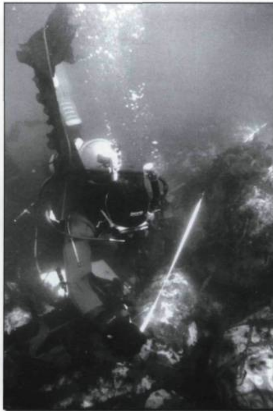
Un plongeur d'un groupe de protection des épaves de Sainte-Anne-des-Monts, en Gaspésie, relève la position d'un canon d'une épave que l'on croit être celle du HMS Viper , coulé à l'automne 1779 lors d'une tempête de neige.

Le Elizabeth and Mary , une petite barque de 45 tonneaux, faisant partie de la flotte d'invasion de sir William Phips était venu devant Québec en 1690. Transportant une cinquantaine de miliciens du village de Dorchester, il se perdit sur la Côte-Nord, près du village actuel de Baie-Trinité. Les textes d'époque nous apprennent que le navire se détacha d'une flotte mise en déroute par une série de tempêtes impitoyables qui débutèrent à la hauteur de Tadoussac. L'emplacement de l'épave près de Baie-Trinité nous suggère que le navire rencontra de sérieux problèmes dès qu'il contourna Pointe-des-Monts, un point névralgique pour la navigation où l'estuaire du Saint-Laurent s'élargit de façon dramatique. Un navire qui, comme le Elizabeth and Mary , descend le Saint-Laurent au cours d'une tempête reçoit la fureur des vents de plein fouet dès qu'il émerge au delà de Pointe-des-Monts. Les fouilles archéologiques sous-marines, effectuées de 1995 à 1997, ont pour leur part mis au jour une collection d'objets qui illustrent le drame humain qui se produisit lors de ce néfaste périple d'octobre 1690. En mer depuis près de