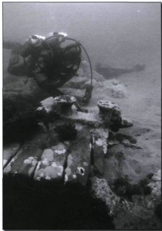
Un conduit pour câble d'amarrage de la barque norvégienne Dylvaag qui s'est brisé contre la côte, en 1906.

circonstances similaires, mais quelque 90 ans plus tard. Ce naufrage illustre bien certaines des pratiques de navigation sur le Saint-Laurent lors de mauvais temps. Le HMS Viper , que l'on croit être l'épave en question, quitta Québec avec une flottille au début de novembre 1779. Lorsque le mauvais temps se leva et que la neige diminua considérablement la visibilité, ce sloop de 223 tonneaux assumait le rôle d'éclaireur pour les autres navires tout en encadrant la flottille du côté de la terre