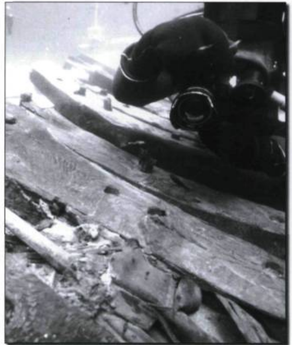
Ces deux chaussures et cette hache de ceinture coincées entre deux membrures du Elizabeth and Mary , navire de la flotte de Phips en 1690, témoignent de l'exiguïté à bord du navire pour les miliciens de Dorchester.

L'élément patrimonial peut-être le plus fondamental du Saint-Laurent nous est toutefois révélé, il nous semble, de façon paradoxale. Si l'on considère que le Saint-Laurent a longtemps été la principale voie d'entrée sur le territoire québécois, la navigation constitue sans aucun doute un des piliers de cette culture fluviale. Même si elle est aujourd'hui quelque peu effacée de la mémoire collective, la navigation sur le Saint-Laurent est toujours mise en évidence par les repères impressionnants que sont les phares. Toutefois, si ces témoins privilégiés de cette épopée maritime du fleuve ne passent pas inaperçus, les navires qui en ont été au cours des siècles les acteurs de premier plan ont pour leur part plus souvent qu'autrement sombré dans les profondeurs des eaux froides et, par le fait même, dans l'oubli. De temps à autre, leurs épaves refont surface pour meubler notre imaginaire et ouvrir une fenêtre sur notre passé.