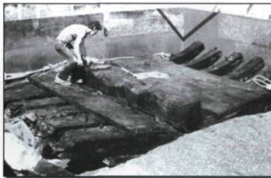
Une section de la coque du Machault remontée lors des fouilles archéologiques par Parcs Canada.

Même amarré, un navire pouvait être la proie du mauvais temps. La rupture de l'une de ses amarres signifiait habituellement une dérive incontrôlable résultant parfois en un échouement fatal. Les fouilles effectuées sur un baleinier basque du XVI e siècle, à Red Bay, au Labrador, ont permis de déterminer, grâce à une analyse poussée de la stratigraphie du site (étude des couches séquentielles de formation du site), que le navire avait dérivé d'ouest en est, rebondi en heurtant le fond avant de finalement s'y asseoir. Forts de ces informations qu'ils ont jumelées avec d'autres données, les archéologues ont pu relier l'épave au récit du naufrage du San Juan qui, en 1565, avait brisé ses amarres lors d'une tempête soudaine pour venir se heurter à la côte. Le scénario se répéta aux Escoumins, plus de 300 ans plus tard, alors qu'une autre barque norvégienne, cette fois de 1 618 tonnes, le Dylvaag , vit une de ses chaînes d'ancre se rompre sous la violence des vents. Le navire dériva pour venir se heurter sur un quai avant de terminer sa course folle sur les rochers où il se brisa. Le