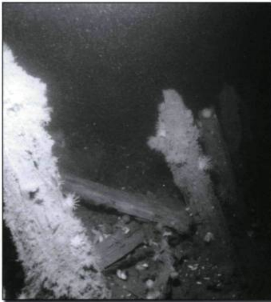
Les membrures de la coque du Bergeronnes Trader , coulé aux Escoumins, en 1936, s'élèvent dans la pénombre du Saint-Laurent. (Photo : Jonathan Moore, Parcs Canada).

La tragédie de la flotte Walker n'est en fait égalée que par une autre, elle aussi causée par le brouillard. Le 29 mai 1914, le cargo norvégien Storstad éperonna le paquebot Empress of Ireland au large de Pointe-au-Père, près de Rimouski, alors que les deux navires naviguaient dans une brume épaisse. La collision créa une immense brèche dans la coque de l' Empress qui coula en moins de quinze minutes, emportant avec lui 840 passagers et 172 membres d'équipage. Aujourd'hui, l'épave de l' Empress est certainement la plus connue au Québec. Sa coque longue de 570 pieds (173 m) qui repose sur le flanc tribord par 48 mètres de fond rappelle aux plongeurs qui visitent ce site surréaliste que même de tels bâtiments n'étaient pas à l'abri des pièges du fleuve.