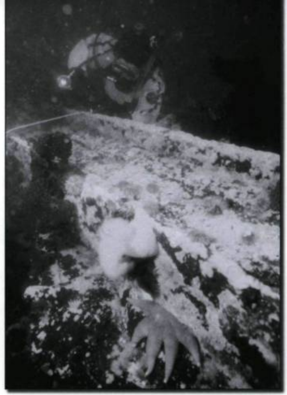
Un plongeur du groupe de Préservation des vestiges subaquatiques de Manicouagan prend des relevés en vue de faire le plan du Signé , coulé lors d'une tempête, en 1908, près de Pointe-des-Monts. (Photo : Marc-André Bernier, Parcs Canada).

La première eut lieu il y a près de 300 ans, en 1711, à l'île aux Œufs, sur la Côte-Nord. Au cours de la guerre de la Succession d'Espagne qui opposait, entre autres antagonistes, la France et l'Angleterre, la flotte de plus de 70 vaisseaux de l'amiral anglais Sir Hovenden Walker remonta le Saint-Laurent en direction de Québec. Walker avait capturé un navire français et utilisa son capitaine, Jean Paradis, comme pilote. À la hauteur d'Anticosti, Walker et ses navires furent enveloppés d'un épais brouillard. Lorsque le brouillard se leva finalement, au début de la nuit du 22 août, sous l'effet de forts vents d'est, la flotte désorientée se retrouva directement sur la Côte-Nord que Paradis leur avait