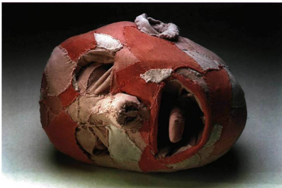
Louise Bourgeois, Why Have you Run so Far Away? , 1999. Tissus; 25,4 x 33 x 25,4 cm.

matériaux anciens et les plus récents, en incluant des objets du quotidien répandus à l'échelle de la planète ainsi que des références à l'histoire et à l'histoire de l'art. Un langage qui, nous l'avons vu, n'exclut pas nécessairement la tradition, en dépit de son accent sur l'actualité. Celle d'une société de consommation où il n'y a plus de choses durables, seulement des apparitions évanescences, comme en témoigne Untitled (1999) de Ann Veronica Janssens (Belgique), une œuvre où les visiteurs pénètrent dans une pièce, dans laquelle la brume réalisée à l'aide d'un dispositif spécial en produit des silhouettes indistinctes. Cependant, si le langage de l'art est devenu international, on peut parler de patois nouveaux, comme celui de l'Uruguay, qui démontre les réminiscences d'un langage propre par l'utilisation de matériaux locaux ou encore par des projets particuliers, comme c'est le cas au Japon avec la plantation de l'arbre kaki, un arbre ne donnant plus de fruits suite au bombardement de Nagasaki et qui reprend vie grâce aux actions menées par des artistes. Un langage où les artistes, par leur vision éclectique du monde, mettent en scène la « téléphagie » (Régis Debray) particulière à cette fin de siècle. En effet, c'est par la télévision que nous nous affranchissons du local, grâce à ce flux d'images qui