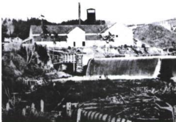
Le moulin du Sault Mackenzie [circa 1902].