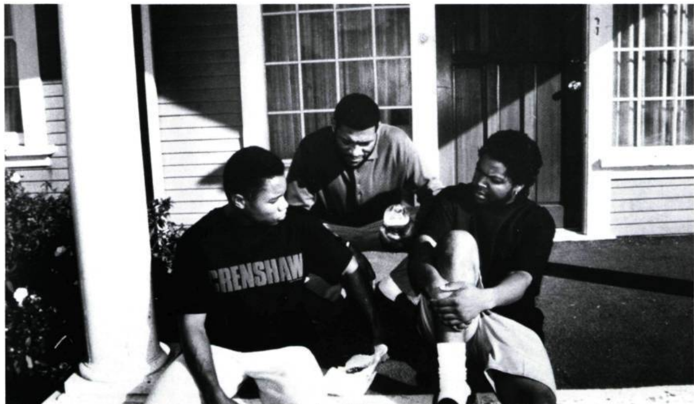
Tre (Cuba Gooding Jr.) avec son père (Larry Fishburne) et Doughboy (le rappeur Ice Cube).

L'Amérique, la blanche comme la noire, est encore aujourd'hui victime d'un préjugé tenace, selon lequel fratricide il y a lorsqu'un Noir tue un autre Noir. Parce que la communauté afro-américaine lui apparaît en général comme un bloc compact et homogène, cimenté de l'extérieur par une répression blanche multiséculaire et, de l'intérieur, par d'insurmontables difficultés socio-économiques, elle persiste à croire que cette adversité fonde la fraternité nègre, l'univers clos des «brothers and sisters». C'est ne pas voir pour une majorité de Noirs, et ne pas vouloir voir pour une société majoritairement blanche, que la criminalité dans les ghettos des grandes villes américaines est à ce point endémique qu'elle produit elle-même l'aliment dont elle se nourrit — la misère noire — et qu'est définitivement révolue, si elle a jamais existé, l'époque où le pigment foncé de la peau protégeait des lames de couteau et des balles de revolver noires.