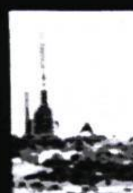
ACTION 80 LAC-ST-JEAN