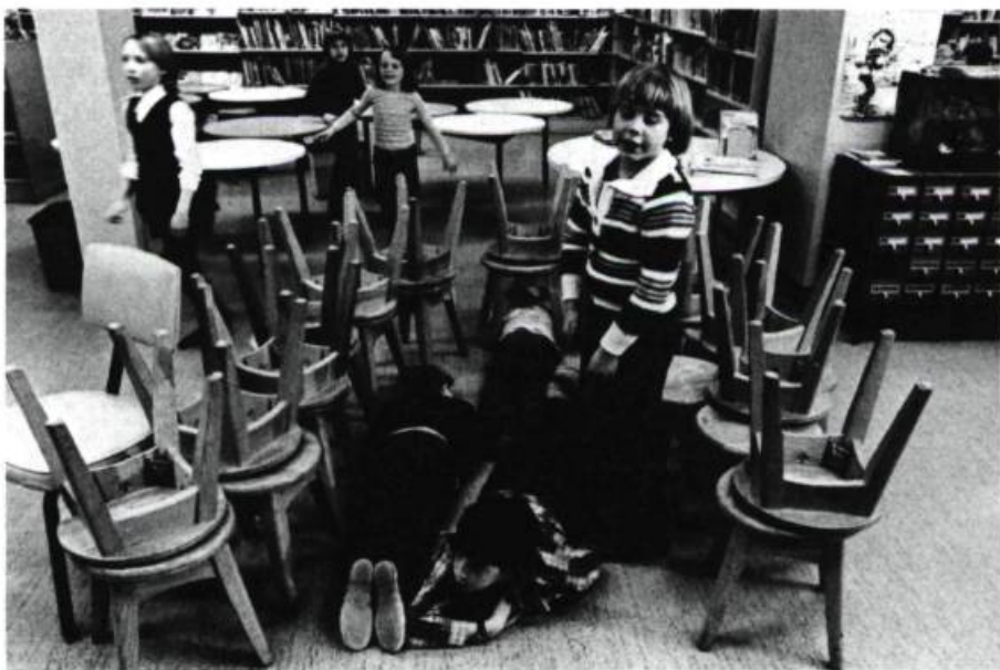
Deux équipes d'enfants dans un atelier d'expression dramatique donné à la bibliothèque des enfants de Longueuil (décembre 1976).

Apprendre à vivre dans le monde, avec le monde et malgré le monde n'est pas plus facile pour nous que pour les enfants; par l'expression dramatique, les enfants apprennent à mieux connaître et à mieux con-