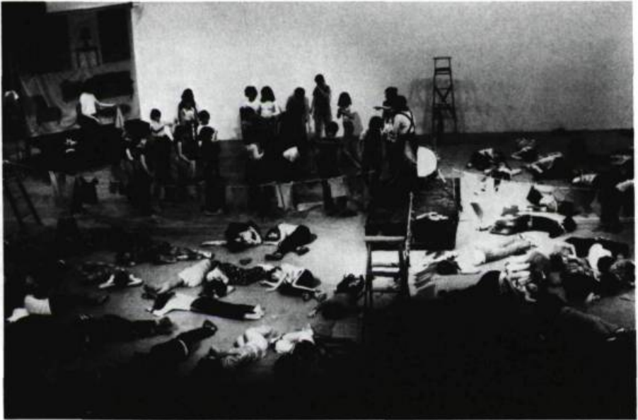
A quoi qu'on joue? (1976). Spectacle-atelier. A Vaudreuil.

mette à cent personnes de participer; par l'expression dramatique, développer une nouvelle façon de jouer individuellement et collectivement; mettre au point des jeux, des règles du jeu et un environnement qui amènent tous les participants à une expression autonome et créative.