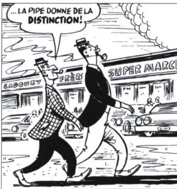
Case extraite d'une planche de la série Onésime d'Albert Chartier. Cette série a été publiée dans le Bulletin des agriculteurs de 1943 à 2000.