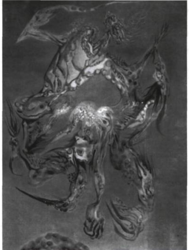
Wolfgang Paalen, Combat des Princes Saturniens III , 1938. Paris (collection Galerie Tronche).

En effet, Crevel défend le communisme avec enthousiasme. Désireux de choquer la bourgeoisie qu'il assure détester (elle est pourtant son milieu d'origine et il la fréquente beaucoup plus volontiers que le milieu ouvrier), il s'érige en justicier décidé à tout pour exterminer les valeurs traditionnelles, la Révolution sociale rejoignant la Révolution artistique. À partir de 1930, les relations des surréalistes avec le parti communiste commencent à se dégrader, et Crevel vit ce conflit d'une manière dramatique : cette année-là, au Congrès de Kharkov, le surréalisme est condamné et, en 1933, Breton et Éluard sont exclus du parti. Crevel soutient Breton et donne sa démission le 6 juillet 1933 5 . Il réintègrera le P.C.F. après quelques mois et, jusqu'à sa mort, deux ans plus tard, il essaiera en vain de rapprocher le mouvement du parti. L'engagement politique des surréalistes a donné naissance à de violents