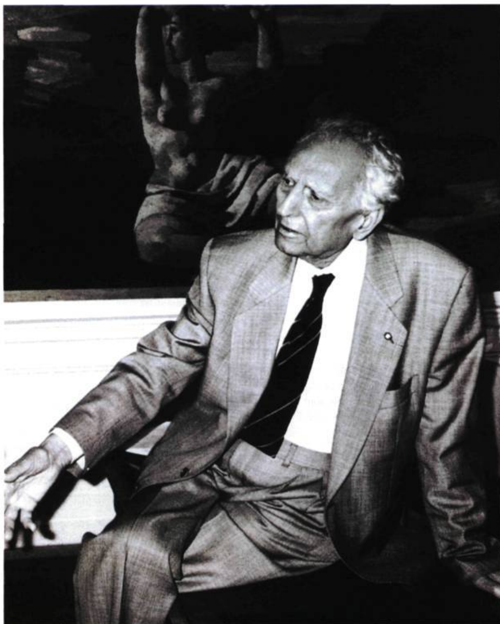
Portrait d'Oscar Ghez, 1991 Musée du Petit Palais, Genève