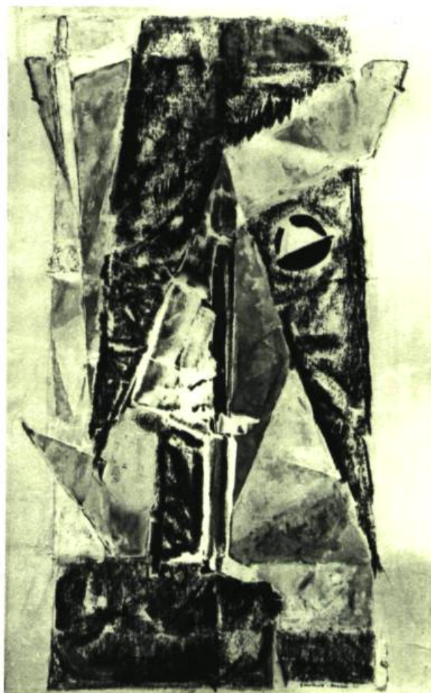
SYLÈNE Crayon et gouache, 14" x 24" (35,65 x 61 cm.) Figure dimensionnelle en équilibre instable comme l'évocation surréelle d'un mythe. Ainsi certains graphismes ont le pouvoir de remuer en raccourci, de suggérer en apparence des visions intérieures projetées hors de soi dans une écriture impulsive. Un oeil de cyclope se tourne vers l'intrados d'une construction géométrique aiguë dont la nervure soutient la poussée. Une provocation de l'artiste à la recherche d'une expression dynamique.