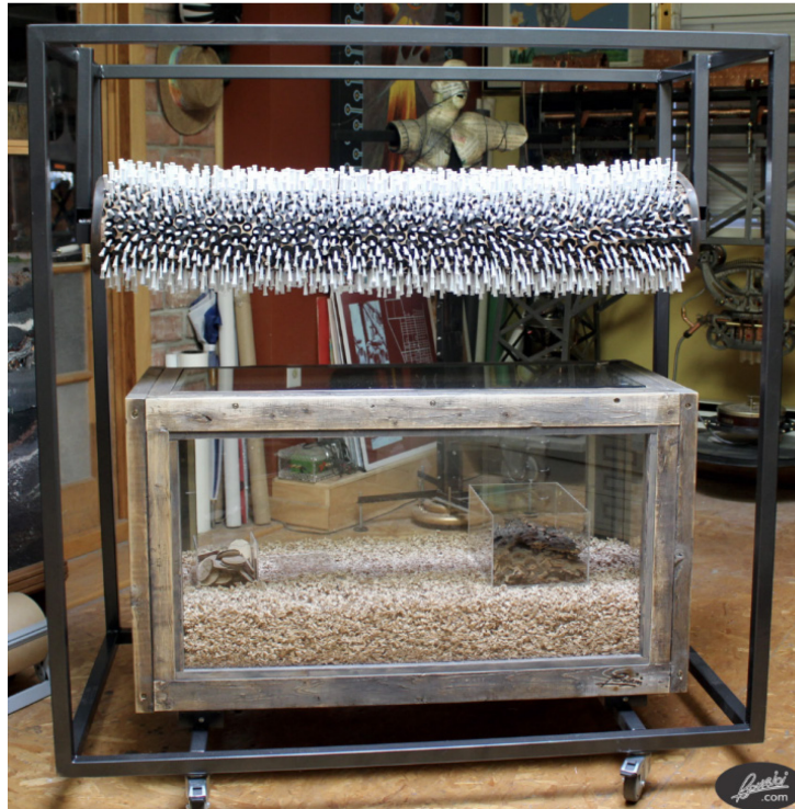
Figure 1. Léopol Bourjoi, Première Vague , 2020, vue d'ensemble de l'installation Première vague 2020

Léopol Bourjoi est un artiste, ou plutôt « artiste ouvrier » (comme il aime se qualifier lui-même, pour démentir le sens de son nom de famille) –, qui vit et travaille à Montréal, où il est une figure bien connue du quartier d'Hochelaga-Maisonneuve.