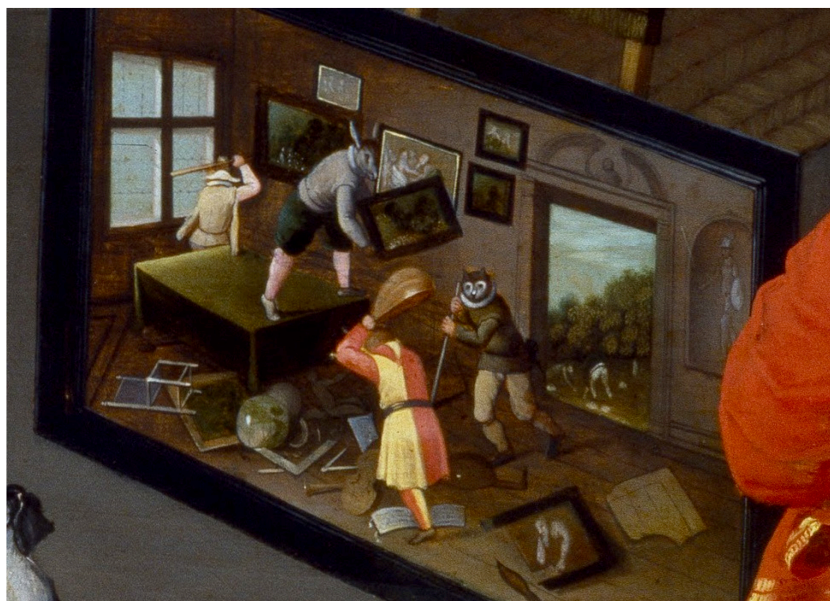
Figure 6. Gros plan de la fig. 1, représentant la destruction.

Comme genre pictural de la (re)présentation, le cabinet de curiosité recrée un univers en miniature avec d'autres mondes imbriqués. Par exemple, dans la fig. 6 est reproduite la structure physique du tableau présenté à la fig. 1, par un procédé de mise en abyme (voir note 2). Dans Un cabinet d'amateur , Pérec (2013) décrit ainsi ce phénomène d'emboîtement : « [p]ar le jeu de ces reflets successifs, par le charme quasi magique qu'opèrent ces répétitions de plus en plus minuscules, c'est une œuvre qui bascule dans un univers proprement onirique où son pouvoir de séduction s'amplifie jusqu'à l'infini » (s.p.). Un autre procédé est à l'œuvre dans ce tableau, car la scène est également renversée : la conservation et la monstration des collections cèdent à la destruction du cabinet représenté. Stoichita (1992) explique ce renversement de l'action comme une dénonciation de l'iconoclasme qui sévissait alors en Europe.