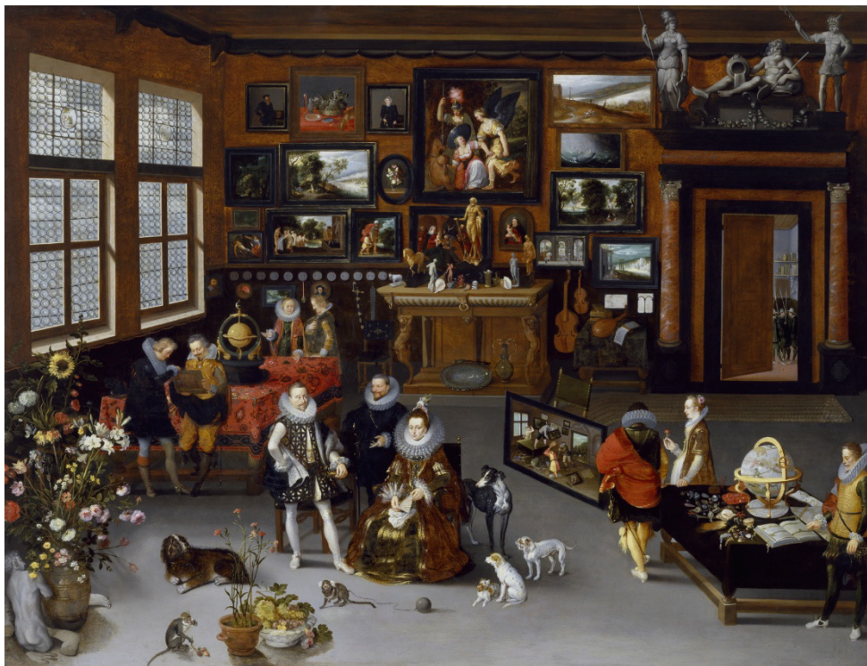
Figure 1. Attribué à Jan Brueghel l'Ancien et Hieronymus Francken II (ca 1621-1623). Les Archiducs Albert et Isabelle visitant un cabinet de collectionneur . Peinture à l'huile sur bois, 94 × 123.3 cm. CC BY-SA 3.0.

et ce que j'appelle une approche métaphorique, lente et renversée. Comme une collectionneuse dans son cabinet, je chercherai à systématiser le fouillis parmi le corpus de données recueillis lors d'une recherche documentaire non systématique sur ce dispositif, en lien avec des données de terrain déjà analysées, qui croisent des groupes scolaires, un groupe en formation des maîtres et mon propre espace de réflexion.