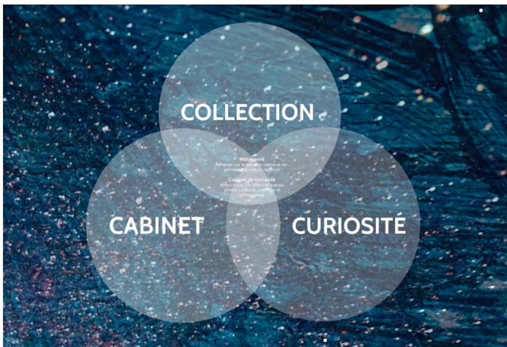
Figure 2. Trois concepts principaux du cabinet. Capture d'écran de la présentation CREA 2024.

Ce processus spontané permettrait-il d'atteindre, à l'instar d'Archimède, « l'Eurêka » de la découverte, de l'apprentissage ou de la création (Koestler, 1965) ? Ce moment où l'on trouve sans chercher, où une nouvelle étoile se met à scintiller et où l'on connecte les astres du savoir en y intégrant la dernière-née ? Dans ce titre, petite création de mots enchaînés, se glisse une métaphore qui, déjà, structure ma réflexion. Une fois bien imbibée d'une proposition, on peut s'immerger dans une expérience (lecture, marche, activité scolaire, visite au musée...), et espérer en ressortir avec de nouvelles pistes d'exploration qui se dégageront des multiples connexions opérées.