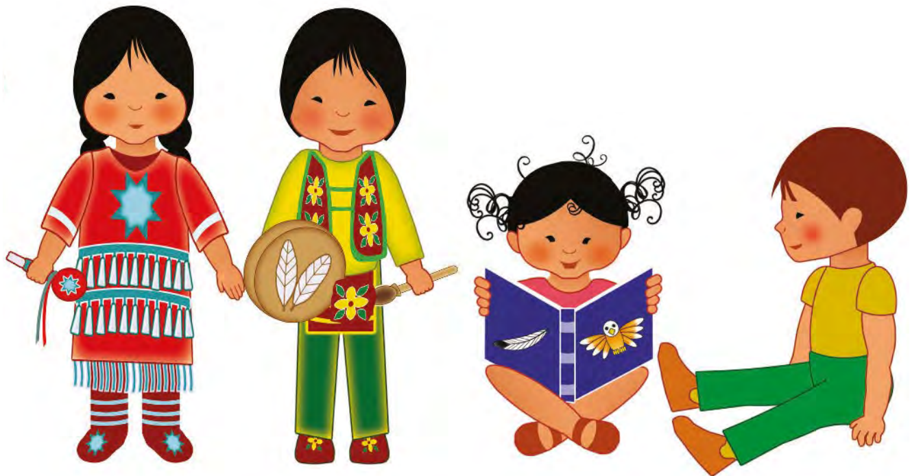
Figure 1. Illustrations de l'artiste abénaquise-wendat Christine Sioui-Wawanoloath

Léonie Thibodeau , étudiante au baccalauréat en adaptation scolaire Université de Sherbrooke