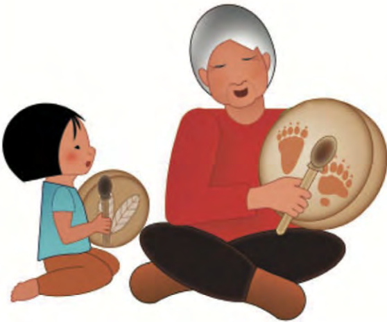
Figure 4. Besoins socio-émotionnels : être guidé

Depuis son lancement, plusieurs personnes se sont senties interpellées par l'outil et ont rapporté des commentaires positifs relatifs à l'utilisation des pictogrammes dans différents domaines (santé, services sociaux, éducation) et différents milieux (communautés autochtones, milieux urbains), ce qui a motivé la relance du comité élargi et même l'ajout de nouveaux partenaires, menant à la proposition d'une trentaine de pictogrammes supplémentaires qui seront intégrés à l'outil disponible gratuitement en ligne sur le site de la Fondation Jasmin Roy et Sophie Desmarais.