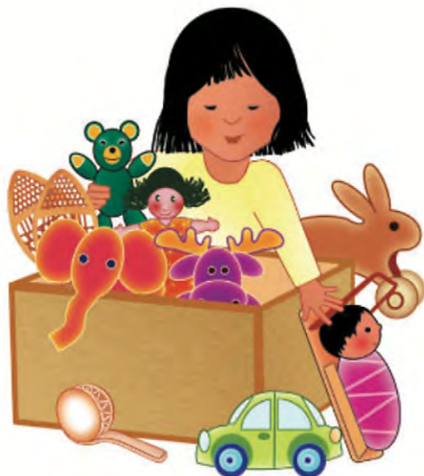
Figure 2. Routines quotidiennes : ranger ses jouets

Les pictogrammes sont des illustrations figuratives schématiques dont l'utilisation est très répandue dans les milieux scolaires, comme outil de communication et de représentation visuelle. Ceux-ci sont également utilisés dans de nombreux autres contextes pour favoriser l'échange, la communication, l'apprentissage et les routines auprès des enfants, ainsi que pour aider à la réalisation de tâches ou l'adoption de comportements explicités. Leur représentation visuelle se veut simple, uniforme et claire, ce qui permet à n'importe quel enfant d'en comprendre la signification.