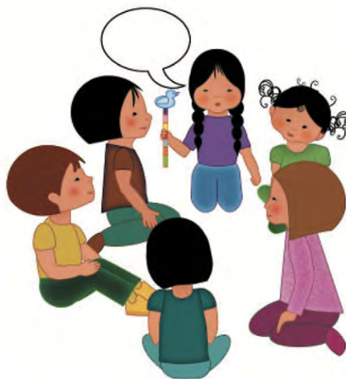
Figure 3. Communications : cercle de parole

La portée de cette ressource peut ainsi s'étendre bien au-delà du système éducatif. En effet, les pictogrammes peuvent être utilisés dans le réseau de la santé, les services sociaux, les milieux de garde, la protection de la jeunesse et les organismes communautaires, par exemple, dans une visée de sécurisation culturelle et sociale (Blanchet et al., 2019). De ce fait, l'outil s'adresse à toute personne qui interagit, dans l'enseignement ou dans l'intervention, avec des enfants des Premiers Peuples. Sans être parfait ni être une fin en soi, il est proposé dans un souci de représenter tant que possible l'ensemble des Premières Nations, Métis et Inuit dans toute leur diversité physiologique. À tous ces égards, ce projet s'inscrit dans le processus de décolonisation-autochtonisation en cours au Québec ainsi que dans le mouvement national de vérité et de réconciliation, par l'inclusion des perspectives autochtones dans les services éducatifs et sociaux, tel que le recommandent les commissions d'enquête (CVR, 2015; CERP, 2019).