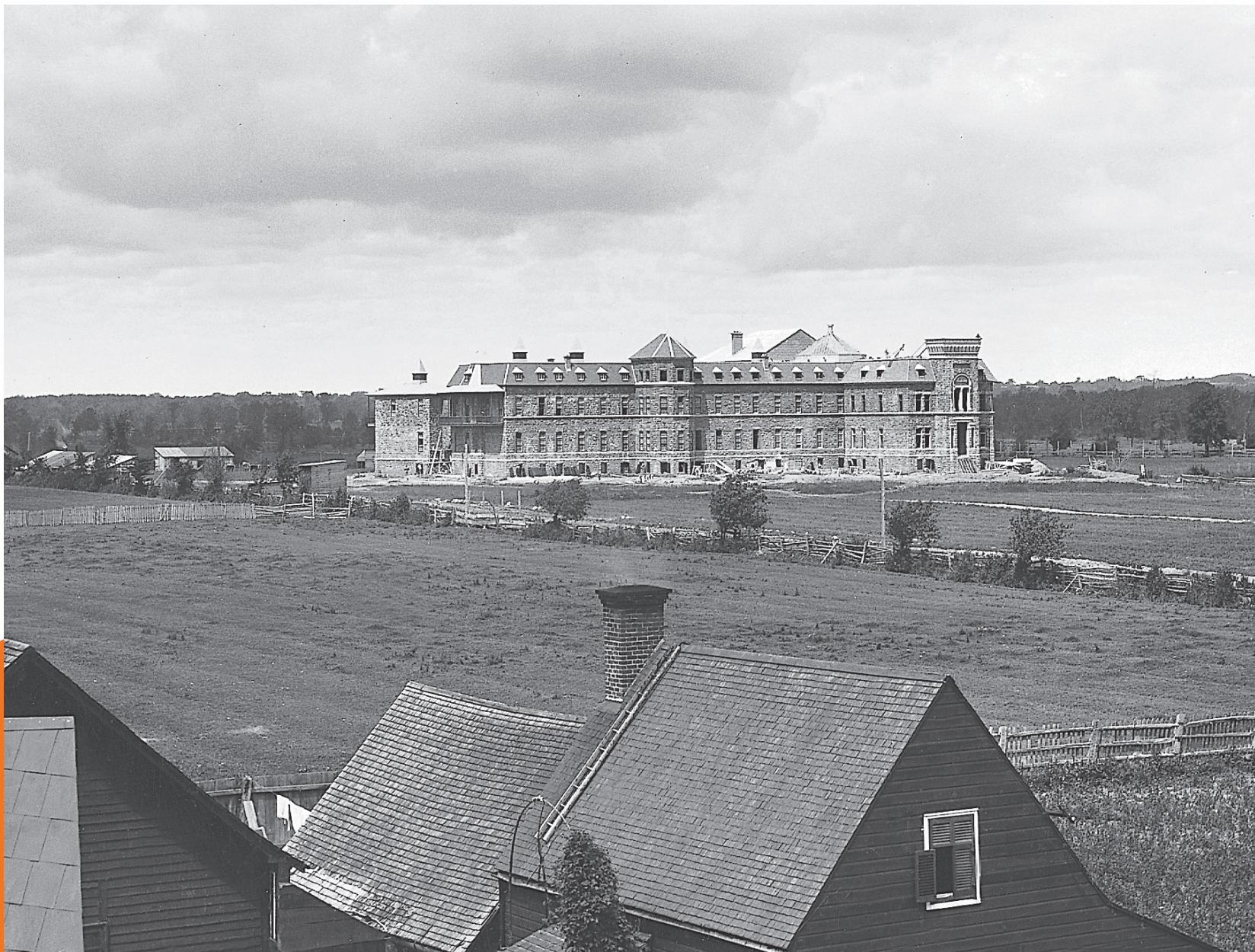
Le Protestant Insane Asylum de Verdun, vers 1890.

William Notman and Son, Musée McCord, VIEW.1980