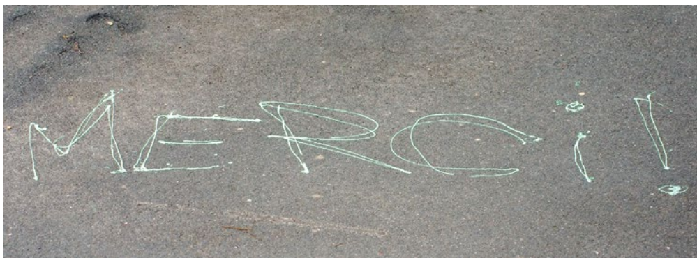
Le collectif d'À bâbord! remercie grandement Martine Delvaux pour ces années de contribution. Bonne route!