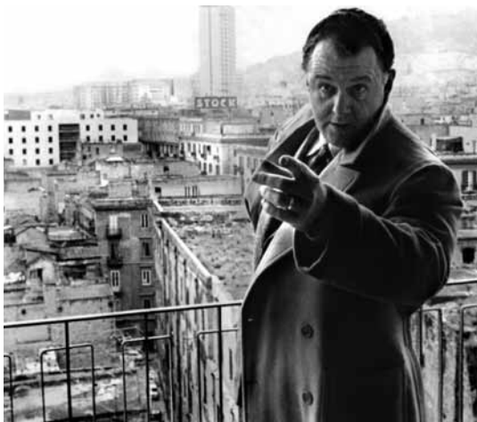
Main basse sur la ville

Lorsque le cinéma s'éloigne du simple divertissement pour s'attaquer au réel, la politique s'avère un terrain de jeu passionnant. Cet univers rempli de manigances, de spéculations et de scandales fournit aux cinéastes une matière particulièrement riche. Que ce soit en politique municipale, dans des simulacres de démocraties ou au sein de véritables dictatures, aucune strate ne semble échapper à la corruption, aux crimes perpétrés par l'État, au recel d'information, aux assassinats, aux abus de pouvoir, à la réécriture historique, aux questions de censure... Autant de thèmes « chauds », aussi fascinants que difficiles, surtout lorsque le cinéma se heurte au contrôle du gouvernement. Pour un récit doublement captivant, le choix d'une narration sous forme d'enquête intensifie encore le suspense. Petit survol en cinq exemples probants.