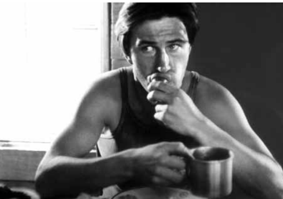
L'Homme de marbre