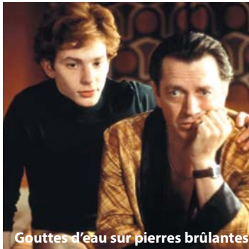
Gouttes d'eau sur pierres brûlantes