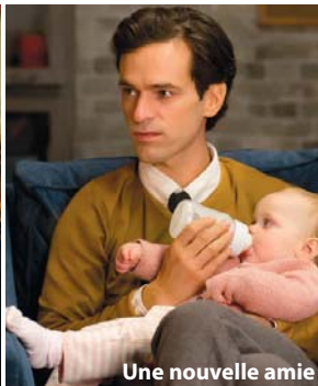
Une nouvelle amie