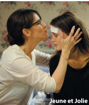
Jeune et Jolie