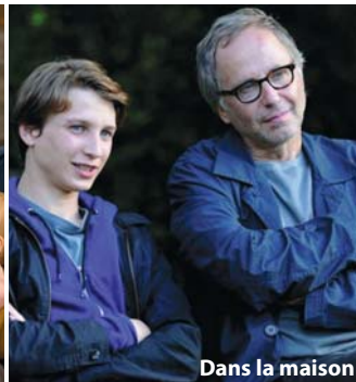
Dans la maison