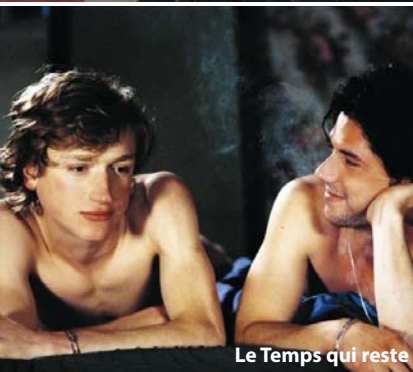
Le Temps qui reste