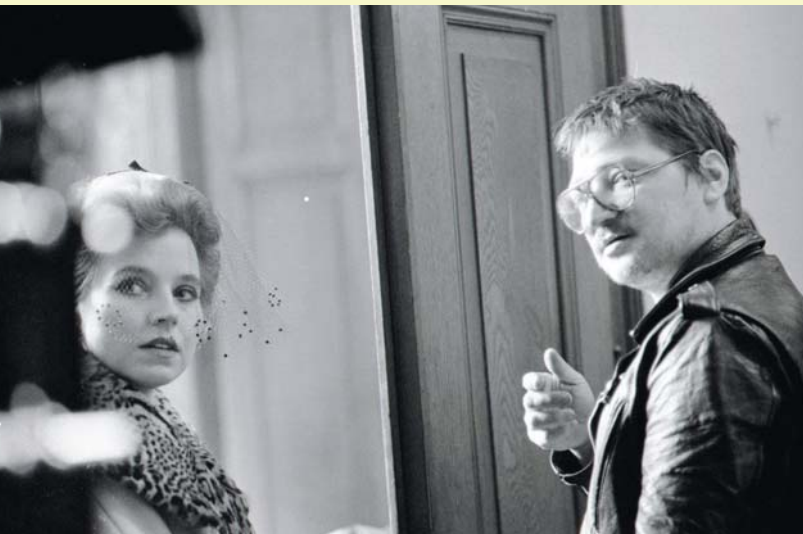
Rainer Werner Fassbinder en compagnie d'Hanna Schygulla sur le tournage du Mariage de Maria Braun