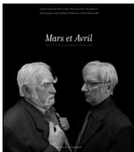
Les deux tomes du photoroman Mars et Avril