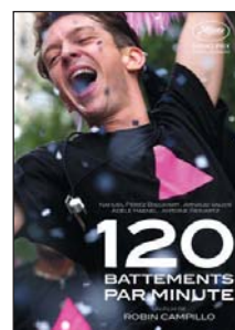
France / 2017 / 140 min