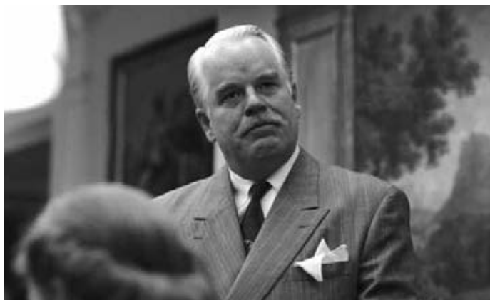
Lancaster Dodd (Philip Seymour Hoffman)

tion que se servent Dodd et son apprenti semble agité d'atomes lumineux et effervescents qui sont, ou bien un effet provoqué par le grain de la pellicule employée en cours de tournage, ou bien un effet intentionnel et discret voulu par le cinéaste. On retiendra aussi ce gros plan du visage de la femme de Dodd alors que ses iris, au cours d'une séance, changent de couleur pour devenir, au final, noires comme de l'encre sous l'effet de sa propre suggestion (l'hypnose n'est pas loin). Mais l'une des plus belles scènes de cette trempe est sans doute celle de la descente policière. Refusant de laisser entrer les policiers dans la maison d'une des éminentes adeptes de la secte, Helen Sullivan (Laura Dern), les personnages, massés sur le balcon avant, semblent former une famille de géants et de nains. Sans doute construit en trompe-l'œil, le décor assemble aux côtés de Dodd