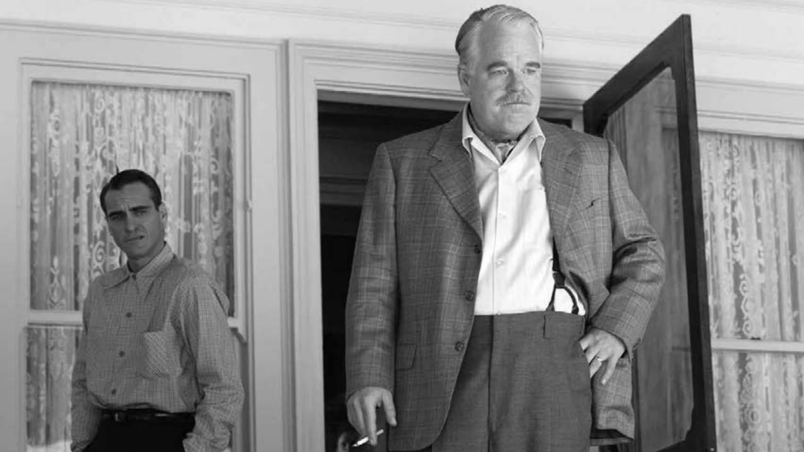
L'apprenti et le gourou

la réalité en continuant de pouvoir rêver. Or, si l'on peut raconter ses rêves dans la réalité, on ne peut pas les montrer ni les voir.