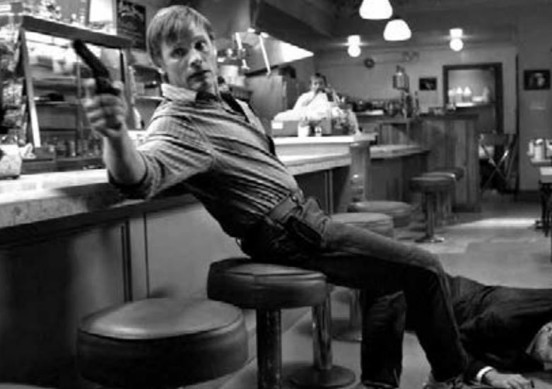
A History of Violence