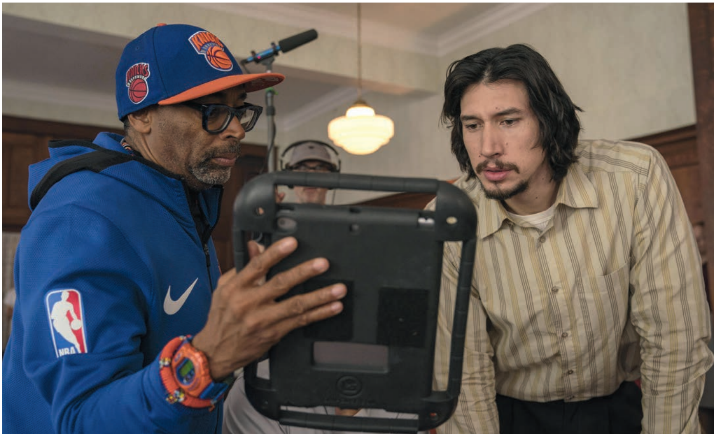
Spike Lee en compagnie d'Adam Driver sur le tournage de BlacKkKlansman

le temps de rencontrer en chair et en os les membres du Ku Klux Klan, devient un faire-valoir. Leur relation repose précisément sur ce favoritisme, longtemps perpétué dans les films policiers, ici renversé : le premier prend les décisions et ordonne, le deuxième écoute et obéit. Lee pousse cette audace jusqu'à faire d'Adam Driver, l'acteur le plus connu de la distribution, un personnage plus effacé et distant au profit du nouveau venu John David Washington, qui brille par son charisme et sa sensibilité. Ancien joueur de football, fils de Denzel et élève à Harlem dans Malcolm X , celui-ci incarne le digne héritier d'une longue lignée de personnages revendicateurs, certains ayant exprimé leur mécontentement avec passion, d'autres devenus des icônes un peu malgré eux. Et l'acteur s'affiche en tant que fier représentant d'une jeunesse que semble affectionner le cinéaste depuis Chi-Raq (2015) où les