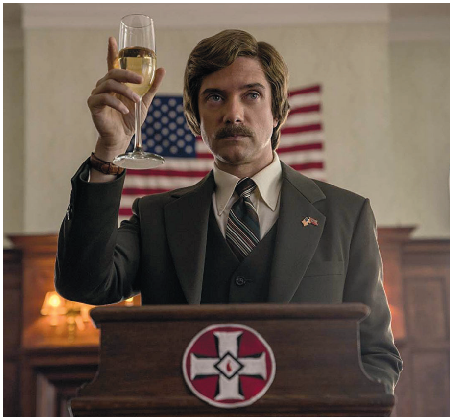
John David Washington (Ron Stallworth), Laura Harrier (Patrice Dumas) et Topher Grace (David Duke) dans BlackKkKlansman

Cette scène, effroyable et insoutenable, dérange non seulement par sa nature — un attentat —, mais surtout par le caractère irrésolu du conflit. Au moment où Stallworth débarque pour empêcher Connie de commettre l'irréparable, cette dernière feint de hurler de terreur devant deux policiers blancs venus en renfort. Ne sachant rien du statut de policier de Stallworth, ils l'interpellent violemment, ce qui ramène au racisme systémique auquel fait face le détective. C'est cruellement grâce à l'arrivée de son collègue Zimmerman que la crédibilité du héros est restaurée et que la criminelle peut enfin être appréhendée. En quelques secondes, Spike Lee rappelle l'humiliation persistante dont souffrent encore les Afro-Américains, au même titre que l'avait fait Detroit (2017) de Kathryn Bigelow en ressassant le sordide épisode du Motel Agiers en juillet 1967. L'approche du réalisateur originaire de Brooklyn est cependant plus contestataire à défaut d'être moins viscérale, ce qui n'empêche pas le long métrage de hanter le spectateur grâce à un épilogue qui renvoie aux terribles manifestations de violence policière perpé-