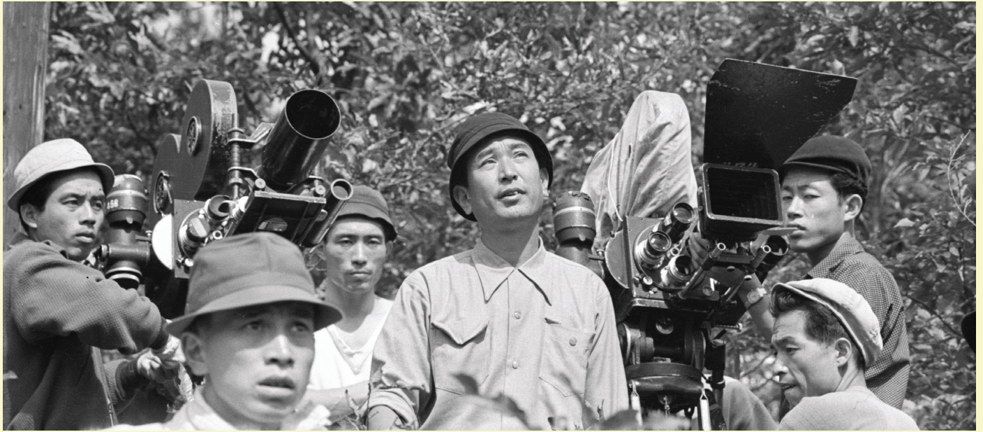
Akira Kurosawa (au centre) lors du tournage des Sept Samouraïs

de champ afin de déboussoler le spectateur, Kurosawa filme de trois points de vue différents et cherche à donner au public l'impression d'être sur le champ de bataille. À l'aide d'un montage qui fait fi des règles du cinéma classique, d'une mise en scène complexe alliant chevaux, figurants, pluie et boue, ainsi que de quelques ralentis qui évitent de magnifier la mort et la rendent plus directe, plus crue, Kurosawa révolutionne la manière de filmer l'action.