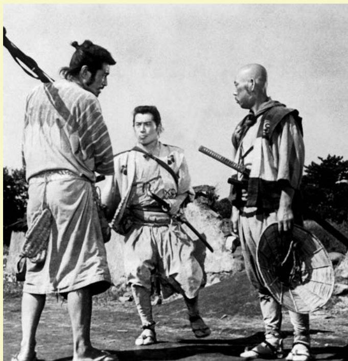
Les personnages Kikuchiyo (Toshirō Mifune), Katsushiro (Isao Kimura) et Kambei Shimada (Takashi Shimura) dans Les Sept Samouraïs

La précision et la minutie dont fait preuve Kurosawa accentuent la maestria avec laquelle il compose ses images. Ses indé-