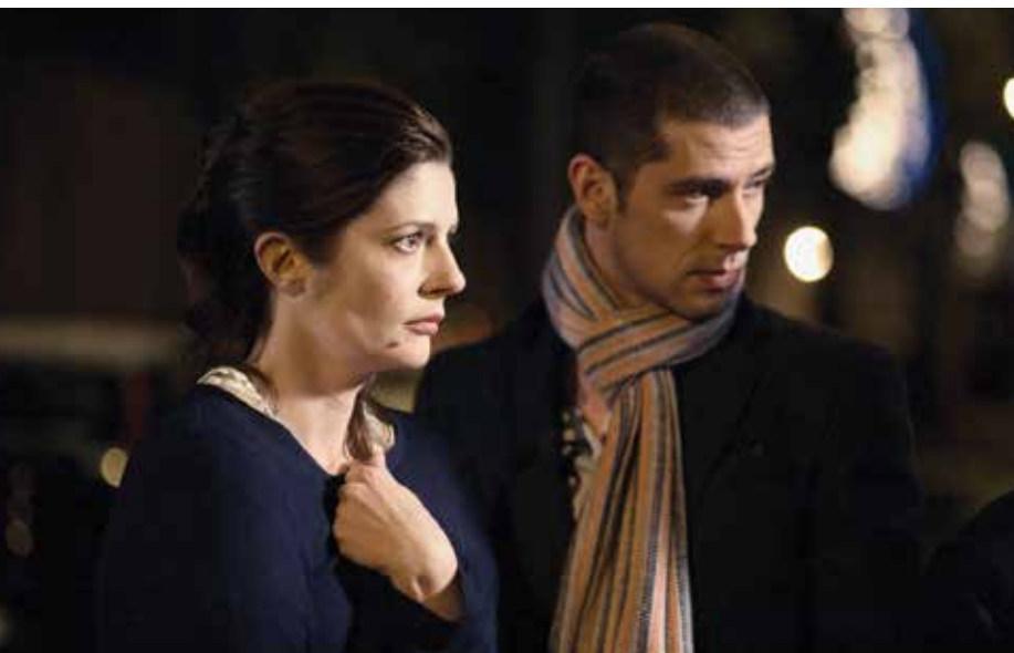
Chiara Mastroianni et Melvil Poupaud dans Un conte de Noël

L'amour est également un pilier narratif important des films du réalisateur. En éternel pessimiste, il n'entretient pas une vision positive de l'amour. Les personnages de Desplechin vivent des amours