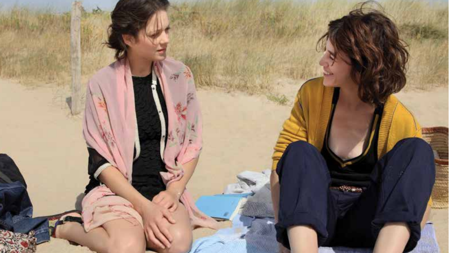
Marion Cotillard et Charlotte Gainsbourg dans Les Fantômes d'Ismaël

répéter ou de discuter de leurs personnages. Les bris du quatrième mur, chez le réalisateur, ne sont pas de vaines expérimentations formelles; ils constituent des jeux complexes avec le médium filmique, par lesquels Desplechin emprunte à la riche tradition du théâtre brechtien et poursuit ses interrogations métaphysiques sur la nature du récit et de la réalité.