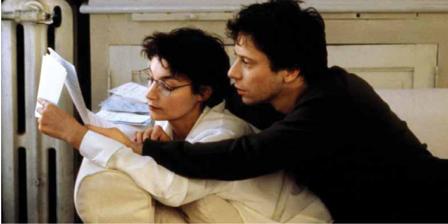
Jeanne Balibar et Mathieu Amalric dans Comment je me suis disputé... (ma vie sexuelle)

tendue et marquée par les divisions. Tout comme sa vision des relations familiales et amoureuses sied bien à un XXI e siècle dominé par l'individualisme.