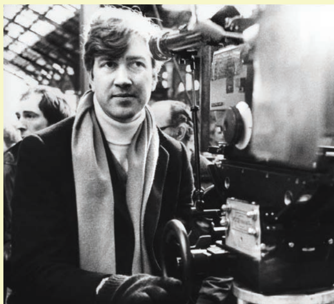
David Lynch lors du tournage d' Elephant Man

Toute l'atmosphère fantomatique d' Elephant Man rappelle également les films d'horreur gothiques du studio Universal. Lynch rend ainsi un évident hommage aux perles du cinéma d'horreur indépendant que sont Freaks (1932) de Tod Browning et Carnival of Souls (1962) d'Herk Harvey. Les