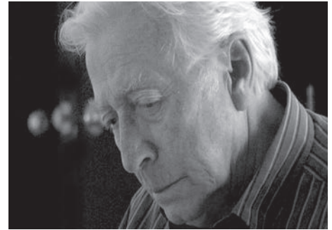
Sur la terre comme au ciel