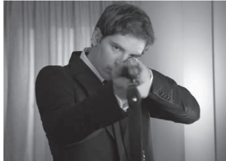
L'Appel du vide