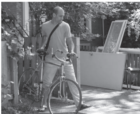
Le Gardien d'hiver

Ce film aborde le thème des liens familiaux, l'un des plus emblématiques des