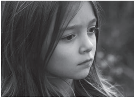
Ce n'est rien