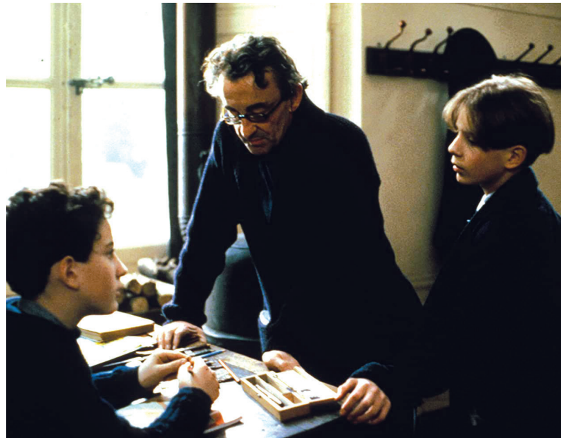
Louis Malle sur le tournage d' Au revoir les enfants

complexe, de Zazie dans le métro qui rendait hommage aux dessins animés de Tex Avery et aux comédies de Chaplin, tous deux remportés haut la main. Tous les cinq ans environ, My Dinner with Andre est un rendez-vous, dont chaque occasion procure des découvertes différentes. La dernière fois, il m'a semblé que la voracité d'André Gregory pour les expériences limites dissimulait mal un dégoût de la vie moderne — cette société de robots aux réflexes conditionnés — qui confinait à la névrose phobique, heureusement contrebalancée par le gros bon sens de son ami (Wallace Shawn), fort peu épris de ce genre d'exotisme et parfaitement content de s'endormir la nuit sous une couverture chauffante. Mais quel parti prendrai-je la prochaine fois que, en confinement ou non, je reverrai le film? Je n'en sais rien. Et c'est pour ça que j'ai hâte.