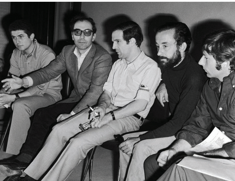
Louis Malle (deuxième en partant de la droite) en compagnie de Claude Lelouch, Jean-Luc Godard, François Truffaut et Roman Polanski au Festival de Cannes en 1968 au moment de l'interruption de l'événement

ou grâce à, ces nombreuses métamorphoses dans la forme comme dans le fond, qui l'ont souvent fait se qualifier d'insaisissable, voire d'auteur incomplet, parce que trop imprévisible. Grave erreur. Ce qui fait tenir ses films dans un continuum fascinant, c'est la question de l'immaturité. Qu'ils soient enfants par leur âge, telle la Zazie de Zazie dans le métro (1960) ou le Julien d' Au revoir les enfants , ou « enfants » malgré l'âge adulte, par leur décalage, leur excentricité, le statut de marginaux que la société leur affuble et où elle les place, l'immaturité paraît en étroite relation avec une liberté existentielle dont on peut payer le prix fort (comme cette passion adultère et charnelle de Fatale , sorti en 1992, qui montre un Jeremy Irons s'éprendre de celle qui serait sa future belle-fille, Juliette Binoche), mais aussi — et c'est là, à mon avis, l'une des grandes beautés de ses films, qui les rend uniques autant qu'indispensables à fréquenter — ne payer aucun prix du tout.