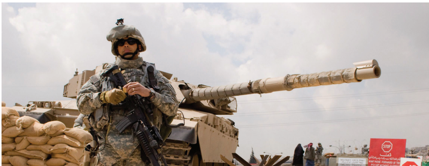
Hi, Mom! et Redacted