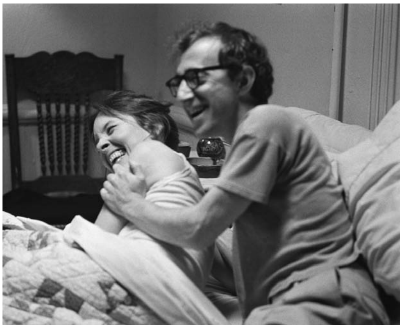
L'Éclipse, Scènes de la vie conjugale et Annie Hall

vouée à l'échec, malgré une brève amourette qui ne la satisfait guère. La façon qu'a Dreyer de traiter le couple diffère sensiblement de celle de Godard et Antonioni. Dans Gertrud , le cinéaste danois brosse un portrait intimiste et introspectif de sa protagoniste. En effet, la métaphore du couple comme incarnation de l'aliénation sociale est moins présente chez Dreyer, qui s'intéresse davantage à la psychologie des personnages que Godard et Antonioni. Dans ce film, les rapports qu'entretient Gertrud avec les hommes sont, comme chez Antonioni, tristes et étouffants, mais il n'y a pas chez Dreyer cette vue de l'intérieur (le couple) pour montrer l'état du monde extérieur (la société).