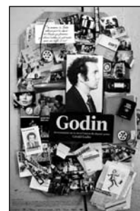
Québec / 2011 / 75 min

RÉAL. ET SCÉN. Carmen Garcia et Germán Gutierrez IMAGE Germán Gutierrez MONT. Hélène Girard PROD. Carmen Garcia DIST. K-Films Amérique