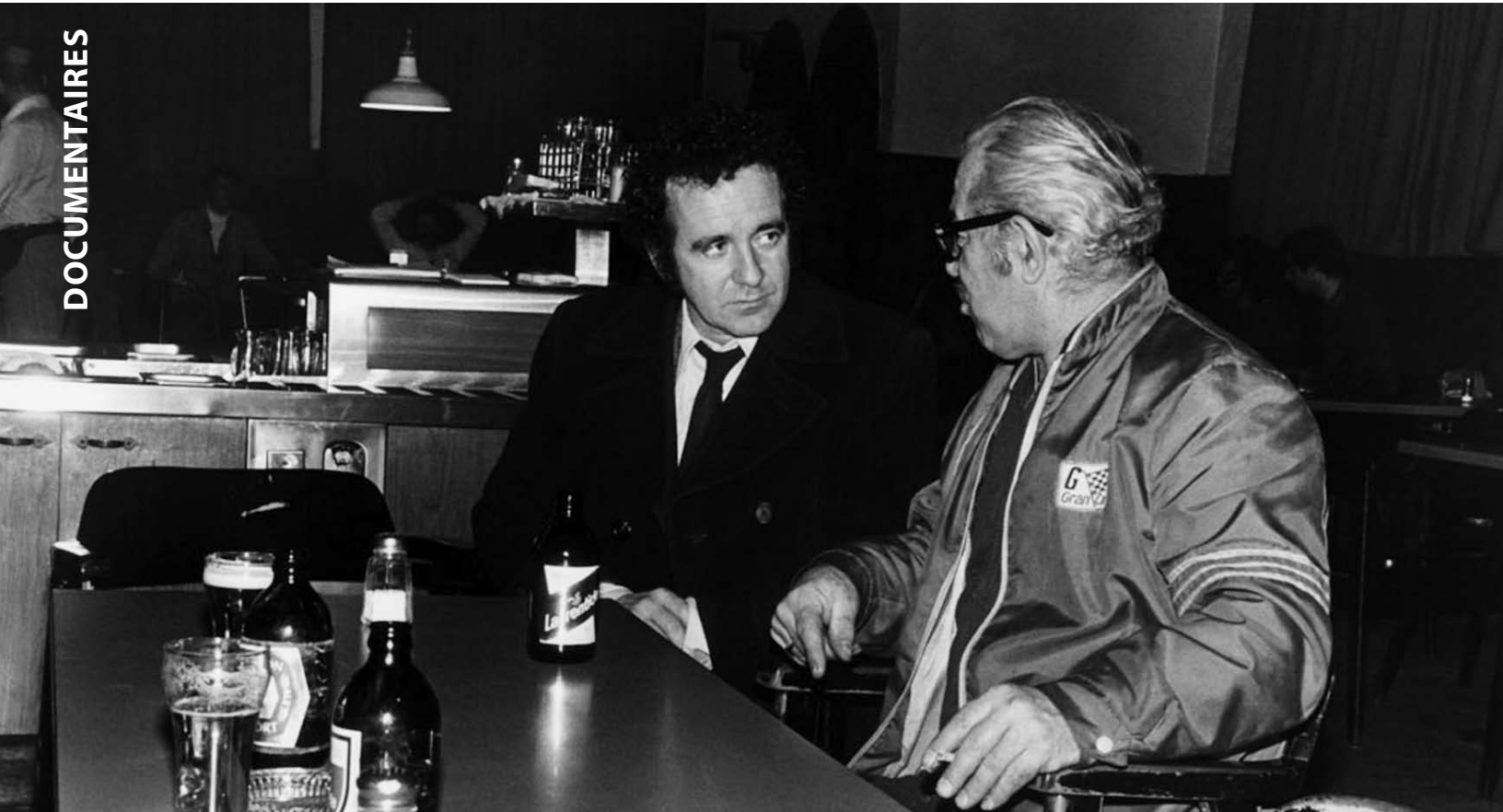
Gérald Godin à l'écoute d'un citoyen...