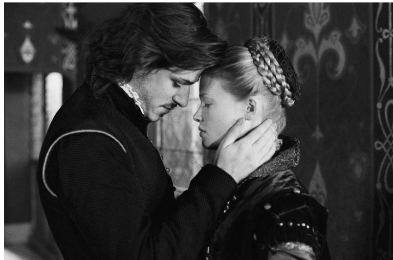
Henri de Guise (Gaspard Ulliel) et Marie de Montpensier (Mélanie Thierry)

hommes et des dieux de Xavier Beauvois), mais sans fausse note, offrant un visage marqué par le temps à la sagesse de son personnage. Sur ces traits, on devine ses failles. Masculin d'un côté, anguleux, puissant et révélateur des forces tourmentées qui l'assaille. Infiniment fin de l'autre, preuve de sa belle sensibilité, de son courage et de sa subtilité. Pour autant, il n'est pas aussi féminin que Raphaël Personnaz, au regard pénétrant, qui souligne une personnalité contrastée, nuancée et tout en clairs-obscurs. Tavernier le représente avec tact et respect, dans toute sa délicatesse, mais sans emphase. Duc d'Anjou et futur Henri III, qui aimait tant s'apprêter, se laver, s'opposer à la guerre, il fut taxé d'homosexualité, réduit aux raccourcis faciles entre féminité et préciosité. L'acteur, mais surtout le regard que porte sur lui Tavernier, force l'admiration. Tout est dit, en attitudes et en gestes, tout le meilleur dont il était capable (aimer, sans réserve), tout le pire également (ses colères, orageuses!).