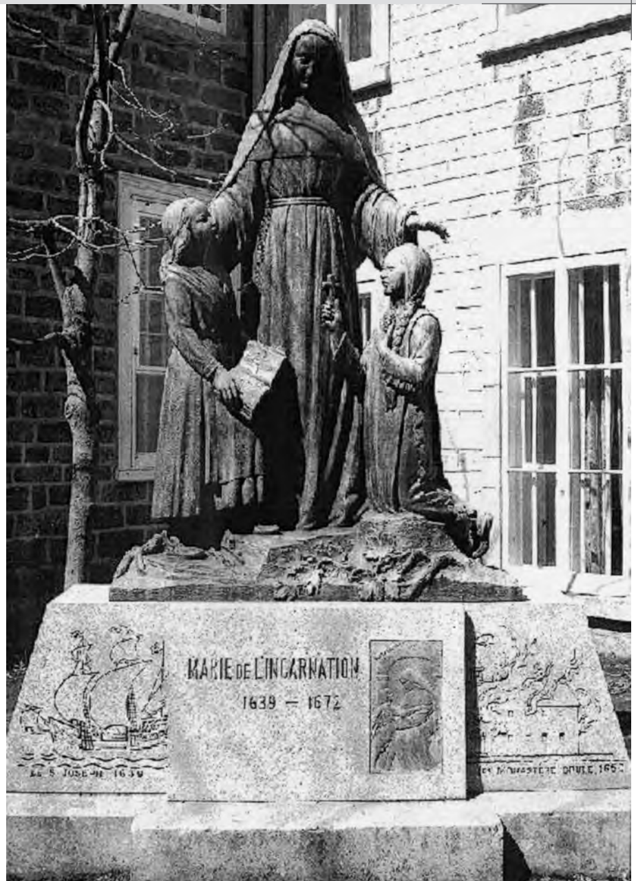
Monument Marie de l'Incarnation près de l'entrée principale du monastère des Ursulines, rue du Parloir, à Québec. Bronze d'Émile Brunet, en 1942.

« Comme il y avait plus de vingt ans que je n'avais pu raisonner sur aucune chose qui tint de la science et spéculation, d'abord cette étude d'une langue si disproportionnée à la nôtre, me fit bien mal à la tête, et me semblait, qu'apprenant des mots par cœur et les verbes – car nous étudions par préceptes – que des pierres me roulaient dans la tête, et puis des réflexions sur une langue bar-