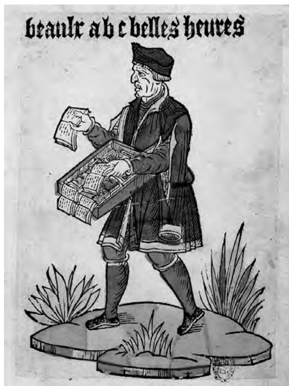
La Bibliothèque bleue fait son apparition au début du XVII e siècle, à Troyes, capitale de la Champagne. Cette région est alors l'une des plus alphabétisées de France. Cette forme de littérature répond ainsi à un besoin de la population en offrant des livres à prix modiques. Ces livres, imprimés sur du papier bleu de piètre qualité, sont distribués par des colporteurs comme on le voit ci-dessus. (Anonyme, Colporteur de livres , Anciens cris de Paris, gravure sur bois, Bibliothèque nationale de France, XVI e siècle, www.classes.bnf.fr/livre/grand/080.htm ).

Si ces pratiques superstitieuses apparaissent condamnables aux yeux des évêques et des communautés religieuses et que ces derniers se montrent sceptiques face à ces croyances, ils demeurent