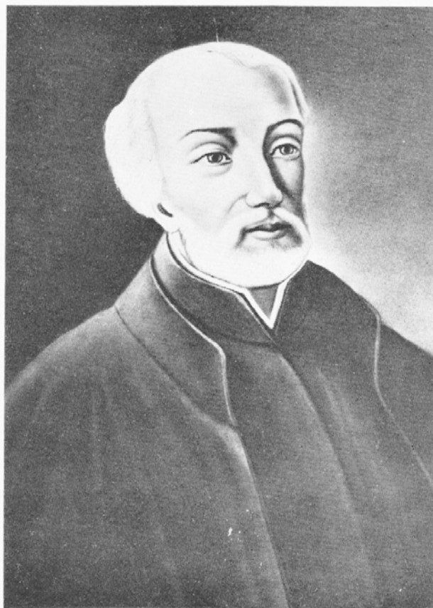
R. P. F.-X. de CHARLEVOIX, S. J.

Ses talents ne s'arrêtent pas là, car les mammifères et l'avifaune de l'Amérique du Nord sont traités par de splendides dessins au trait, cependant moins achevés que ses planches botaniques. On notera toutefois que certains animaux, comme