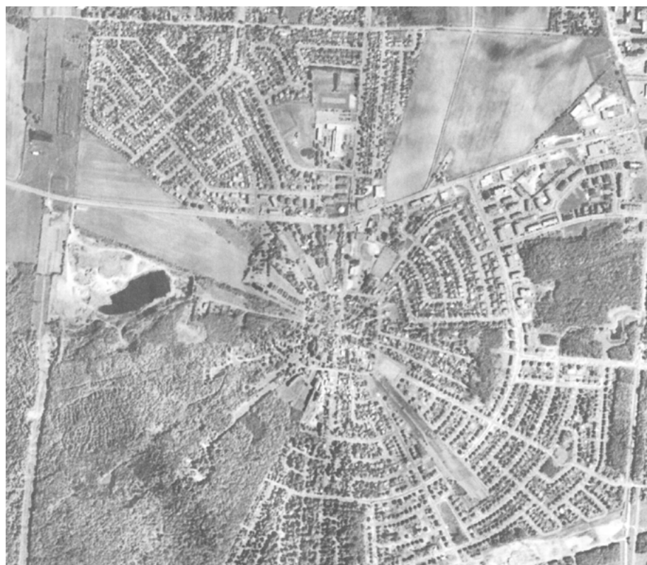
Le trait carré de Charlesbourg aujourd'hui.

et des petits commerces s'implantent à travers les maisons de ferme. L'église actuelle est construite en 1830 et le nouveau presbytère en 1875. Le couvent des