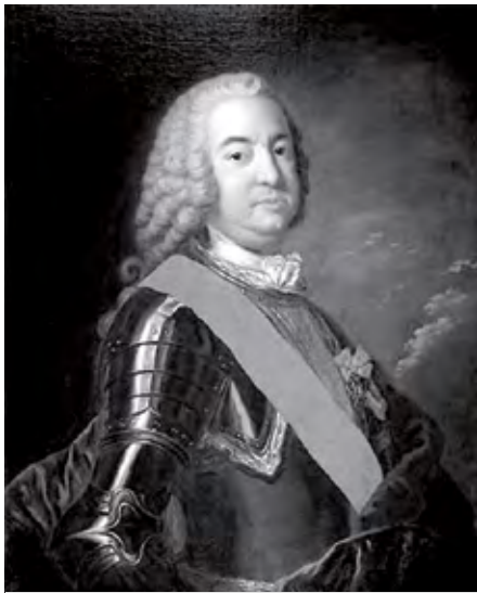
Portrait de Pierre de Rigaud de Vaudreuil de Cavagnial (1698-1778), marquis de Vaudreuil, qui reçoit une commission d'enseigne à l'âge de dix ans sous recommandation de son père, Philippe Rigaud de Vaudreuil (1650-1725), marquis de Vaudreuil, qui est à ce moment gouverneur de la Nouvelle-France.