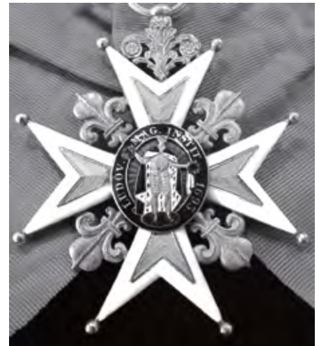
Croix de Saint-Louis (1693-1715). Cette décoration, créée en 1693 par Louis XIV, est une récompense très prestigieuse destinée aux officiers militaires. Plus d'une centaine d'officiers canadiens en seront décorés.

Pourquoi devenir seigneur alors si la seigneurie canadienne rapporte peu? La majorité des familles ont obtenu gratuitement leur fief durant le XVII e siècle alors que l'État croyait favoriser le peuplement de la colonie et faciliter son administration en distribuant géné-